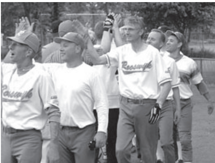
De blijde mannen van Rooswijk

Velsen - Schakelklassen in het basisonderwijs zijn bedoeld voor leerlingen met een taalachterstand. In het kader van Weer Samen Naar School zijn op basisscholen de Zandloper, Klipper, Triangel en Vuurtoren al schakelklasactiviteiten. Deze zullen ook volgend jaar worden voortgezet. Bovendien zal ook op de Vliegende Hollander een schakelklas komen. De schakelklassen zijn bedoeld voor leerlingen in groep 1. De betreffende leerlingen krijgen gedurende acht uur per jaar extra taalonderwijs. Het gaat in Velsen om 80 tot 90 kinderen in het schooljaar 2008/2009. De kosten voor de schakelklassen bedragen voor dat schooljaar 75.000 euro.