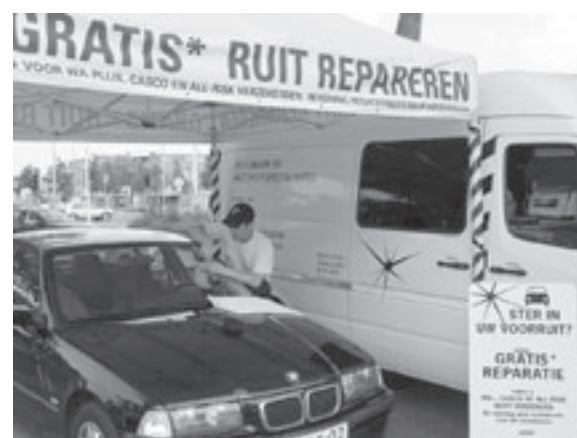
Let op de gele tent en gele bus van Automark

Maandag 23 juni van 09.00 tot 17.30 uur op de parkeerplaats van het Velserveduinplein in IJmuiden