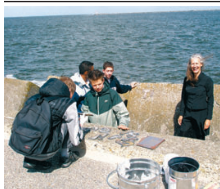
De letters worden op de blokken van de pier gelijmd

IJmuiden - Een paar honderd feestgangers hebben vrijdag de Lange Nieuwstraat in IJmuiden volledig op zijn kop gezet na de EK-Wedstrijd van Nederland. Na de met 4-1 gewonnen wedstrijd tegen Frankrijk stroomde het centrum van IJmuiden vol met een uitzinnige menigte. Vuurwerkknallen, stadionfakkels en toeters maakte het feest compleet. De politie hield de feestende massa goed in de gaten gehouden maar hoefde niet in actie te komen.