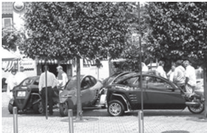
Zes Carvers pauzeerden even bij De Wildeman voor een 'pitsstop'

zorgd, dus inclusief lunch, diner, hapjes en drankjes en de eindbarbecue. De kosten zijn 299 euro per kind. Als uw kind niet alleen wil gaan, is het misschien leuk samen met een vriend of vriendin af te spreken. En er zijn nog diverse mogelijkheden. Per week geldt een maximum van 50 deelnemers. Voor volwassenen en kinderen die niet mee kunnen doen aan de vakantieweken is er een troost: de lessen en mogelijkheden van SnowPlanet staan ook deze zomervakantie voor u open. Dus bent u toe aan een verfrissend uitje, denk dan eens aan een uurtje skiën of snowboarden op de 230 meter lange helling. Ook zomers is de echte sneeuw in SnowPlanet ijskoud. Dit uitstapje kunt u als u wilt heerlijk afronden met een lekkere lunch of diner in een van de restaurants, zoals The Lodge. Of met een verfrissend drankje op het buitenterras. Vraag eens naar de verschillende mogelijkheden en arrangementen. Voor alle informatie en inschrijvingen, kunt u bellen met 0255-545848 of board naar: www.snowplanet.nl