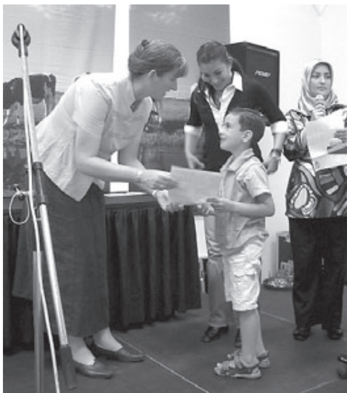
De Opstapdiploma's sluiten twee leerzame jaren voor moeder en kind af.

een grote living met open keuken, en daarnaast twee of drie slaapkamers. Een eigen parkeerplek is inbegrepen bij de koopprijs; bij een penthouse horen zelfs twee privé parkeerplekken. Verder is er nog een viertal garages gesitueerd op het perceel, met ingang aan het Krommeland. Deze worden afzonderlijk te koop aangeboden. De naam Cooyweyde grijpt terug op een roemrijk verleden. Zo ongeveer op de plek van het nieuwe appartementencomplex bevond zich volgens oude kaarten de eendenkooi behorend bij de buitenplaats Meervliet. Belangstellenden kunnen de verkoopbrochure ophalen of bestellen bij Prismaat Makelaars, Koude Horn 3, 1941 KA Beverwijk. Telefoon 0251-26 20 60, e-mail: beverwijk@prismaat.nl.