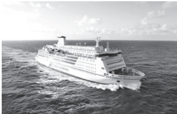
The King of Scandinavia

nimum inkomen heeft, Nederlander bent of hiermee gelijkgesteld en u woont in Velsen dan heeft u een grote kans om voor deze regeling in aanmerking te komen. Formulierenbrigade Velsen zal samen met u kijken of u in aanmerking komt voor deze regeling en u er mee helpen om het aan te vragen. Maak een afspraak, via de telefoon of e-mail. Even langskomen kan natuurlijk ook altijd. Lukt dat niet dan komt de Formulierenbrigade bij u thuis. U kunt hen bereiken via telefoonnummer: 0255-533885 of e-mail: formulierenbrigadevelsen@madi-mk.nl. Als u langs wilt komen is het adres: Loket Velsen voor Vrouwen, Welzijn en Zorg aan Rijnstraat 2, 1972 VG IJmuiden.