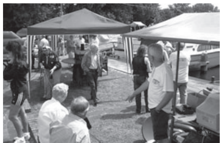
Het belooft, net zoals vorig jaar, weer een gezellige dag te worden

Geheel verzorgd 350 euro, excl. reis- en annuleringsverzekering. Alleen nog 2 persoonskamers.