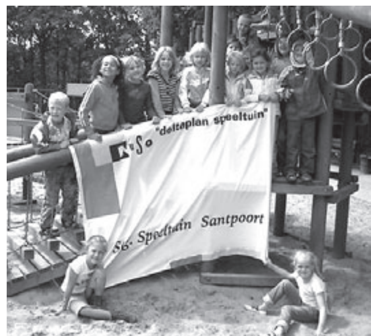
Zaterdag is het Landelijke Speeltuindag