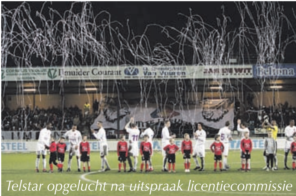
Telstar opgelucht na uitspraak licentiecommissie