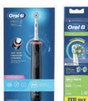
Oral-B Compleet assortiment