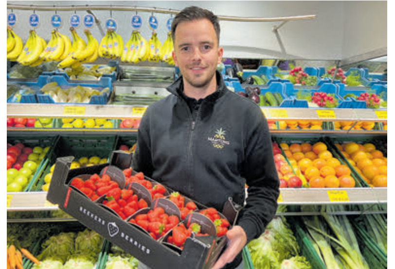
Superverse groenten en fruit en de gezelligheid van een buurtwinkel.

geheel”, zegt Tom. „Mensen vinden het ook prettig hier te komen winkelen voor de dagelijkse boodschappen. Makkelijk en gratis parkeren ook. Het maakt het boodschappen doen zo veel leuker en