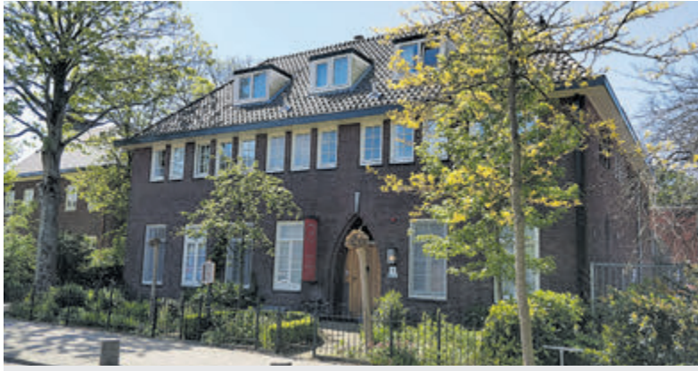
Het liefste huis van Velsen houdt Open Huis. Foto: aangeleverd Hospice de Heideberg