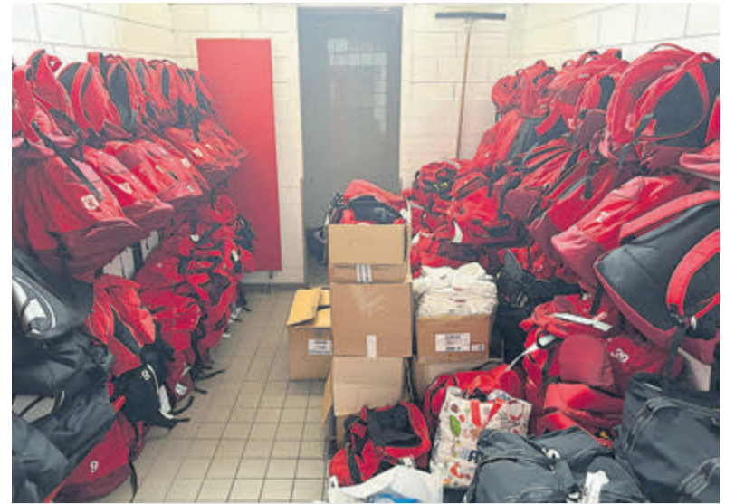
Donatie van oude ballen en kleding aan het COA.

Wilt u ook uw straat opleuken met kleurrijke bloemen? Ga dan naar www.samenvelsen.nl en start samen met uw burens een buurtinitiatief.