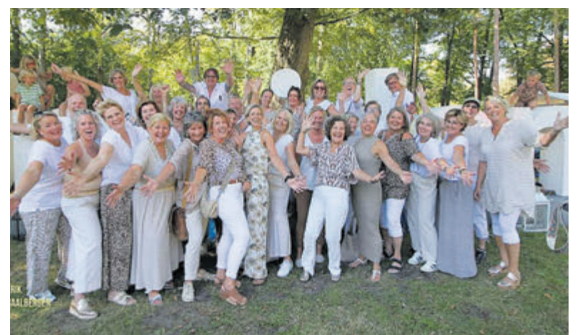
Zingsation op Summer Park Sessions, wat een gezellige groep!

Vader en zoon Dietvorst steken veel tijd in deze sport door zowel in binnen-als buitenland te trainen. De vader van Aidan zegt: „In de avonden zijn we vaak aan het sleutelen om het spul weer voor elkaar te hebben voor de volgende wedstrijd. We reizen stad en land met zijn tweetjes in de bus. Dus dit kampioenschap voelt toch als loon naar werk.“