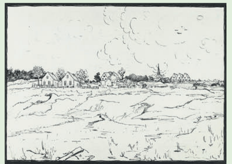
Tekening van het "Hanenland" in Velseroord ca. 1920, met op de achtergrond de Paterskerk bij de hoek van de Zeeweg en Willemsbeekweg. De maker is niet vermeld. inv.nr. 4692

Na onderhandelingen met een rijksadviseur kiest de gemeente in 1920 toch voor het Hanenland, en meer specifiek aan het ontworpen Stationsplein in Velseroord. De minister gaat akkoord mits de gemeente garant staat voor het