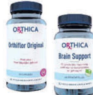
Orthica Compleet assortiment