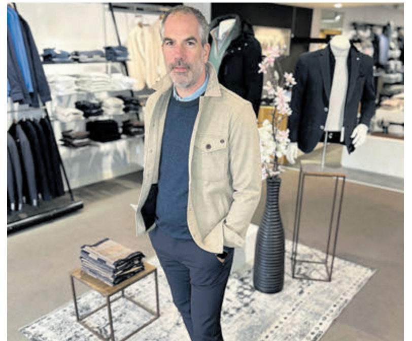
Mooie tinten, maximaal comfort en optimaal draagplezier bij Van Delden Mode.

De kleuren blauw en beige zijn echt altijd goed combineren voor verschillende momenten en gelegenheden.