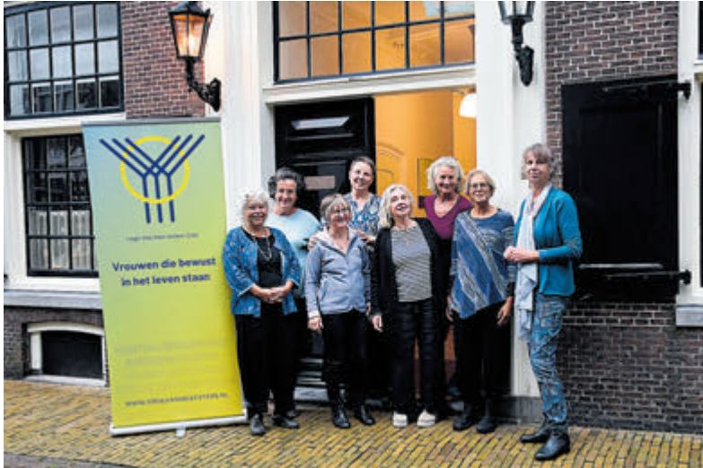
Loge Vita Vera heet belangstellenden van harte welkom.

Velsen - Op woensdag 9 oktober is er een avond voor belangstellenden van loge Vita Vera te Velsen, onderdeel van de Orde van Weefsters. Vita Vera, het ware leven. Wat houdt dat in, zo'n loge?