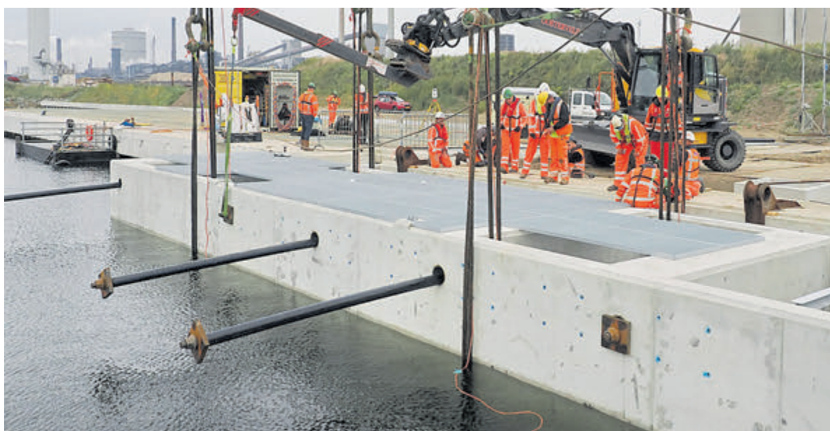
Het inhijzen van de vispassage van de zoutdam.

In oktober wordt de laatste hand gelegd aan de zoutdam met de installatie van de beweegbare, stalen deur. De zakdeur is nodig om onderhoudsschepen voor het Spui- en Gemaalcomplex het Binnenspuikanaal op te laten varen. De plaatsing van de zakdeur markeert de voltooiing van de zoutdam, die naar verwachting eind 2024 volledig operationeel zal zijn.