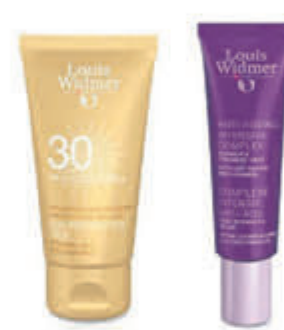
Louis Widmer Compleet assortiment