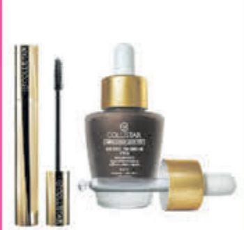
Collistar Compleet assortiment