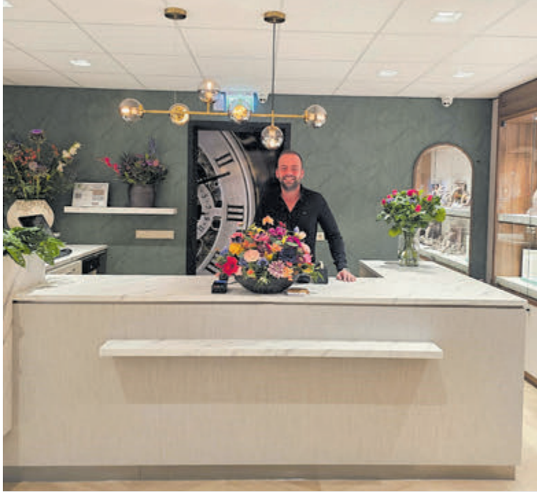
De zaak lijkt wel dubbel zo ruim geworden.