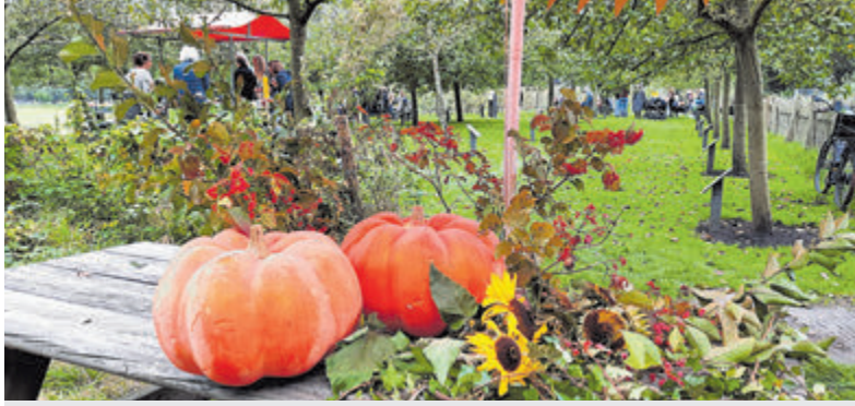
Proeven, beleven en ontdekken op het Boerenerf Herfstfeest.