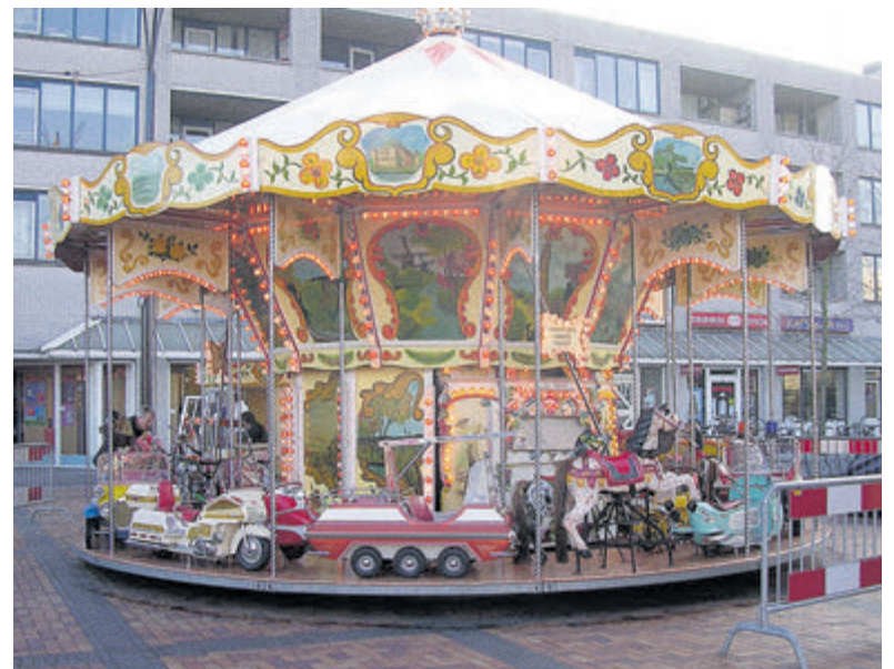
Dat wordt weer dikke pret voor jong en oud op het Vestingplein.

Velsbroek - Het is weer zover, de Kinderkermis in op het Vestingplein in Velsbroek komt er aan! En er staan natuurlijk weer superleuke leuke attracties voor groot en klein. De draaimolen, de Rupsbaan, Partybank, en diverse spelletjes zoals de muntjesschuiver. En de traditionele oliebolenkraam mag uiteraard niet ontbreken. Kortom; alles wat bij een gezellige kermis hoort. De openingstijden zijn woensdag, zaterdag en zondag om 14.00 uur, donderdag en vrijdag vanaf 14.30 uur. De kermis sluit elke dag rond de klok van 22.00 uur. In deze editie van de Jutter|Hofgeest staan de welbekende kortingsbonnen voor lekker voordelig kermisvieren. Knip deze uit voor een aantrekkelijke aanbieding voor elke attractie.