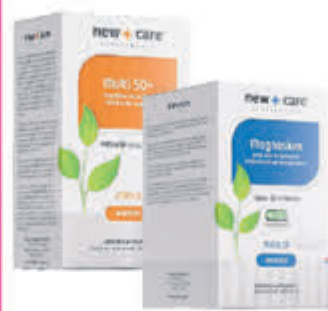
New Care Compleet assortiment