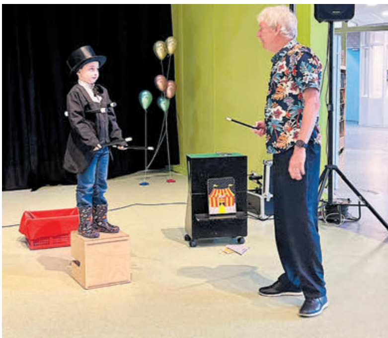
Er werd groots gevierd dat peuteropvang Zoëff! van Zoople Velsen en basisschool De Zefier voortaan verdergaan als Kindcentrum De Zefier.

IJmuiden - Op vrijdag 27 september werd op De Zefier groots gevierd dat peuteropvang Zoëff! van Zoople Velsen en basisschool De Zefier voortaan verdergaan als Kindcentrum De Zefier. Er was een fantastische dag voor de ouders en kinderen georganiseerd.