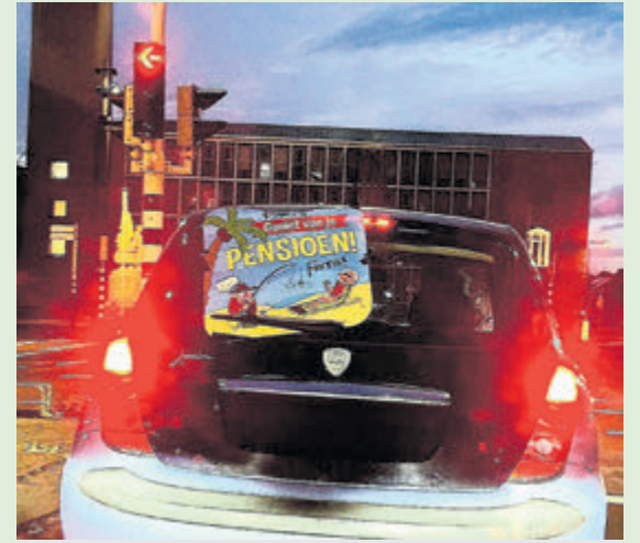
Daar gaat ie dan, na het afscheidsfeestje in Oma's Kamer.

vanochtend na het ontbijt ontdekte ik, door mijn verstrooidheid dat het deksel van een middelgroot potje Marmite (het 4 oz net formaat) precies past op een klein potje Heinz sandwich spread. natuurlijk heb ik toen meteen geprobeerd