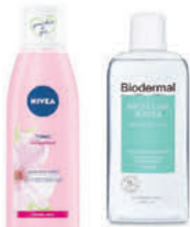
Nivea & Biodermal Compleet assortiment