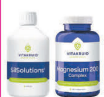
Vitakruid Compleet assortiment