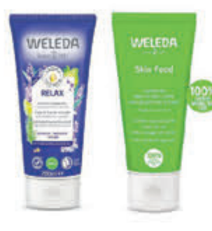
Weleda Compleet assortiment