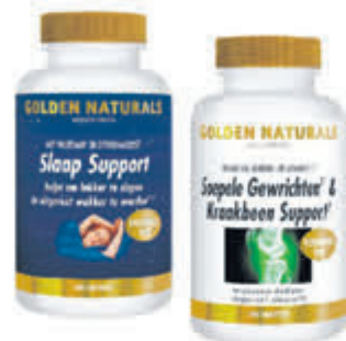
Golden Naturals Compleet assortiment