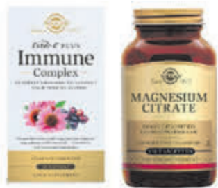
Solgar Compleet assortiment

Alkmaar • Bergen • Beverwijk • Castricum • Heemskerk • Santpoort-Noord • Uitgeest • Wormerveer