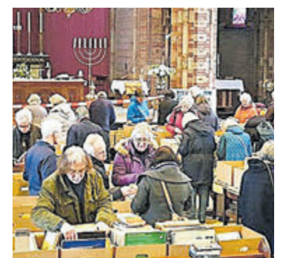
De boeken worden per categorie aangeboden.

Alles wat u koopt is voor het goede doel, namelijk het onderhoud van de monumentale Engelmunduskerk 'Hart van Driehuis'. Markt beide dagen geopend van 10.00 tot 16.00 uur.