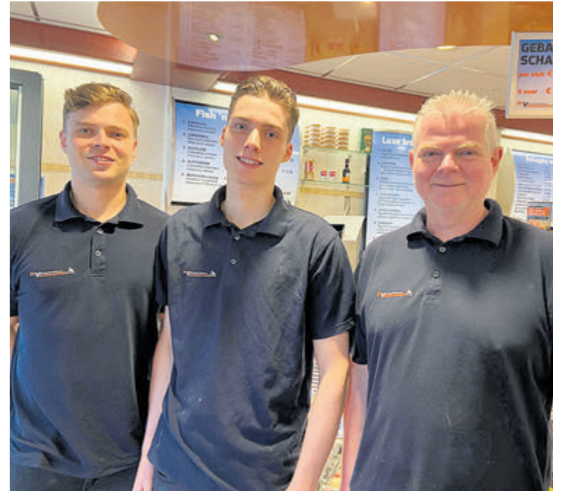
Een heel gezellige zaak zo met die drie aardige mannen.

Geïnteresseerden kunnen zich aanmelden via vitavera@ordevanweefsters.nl .