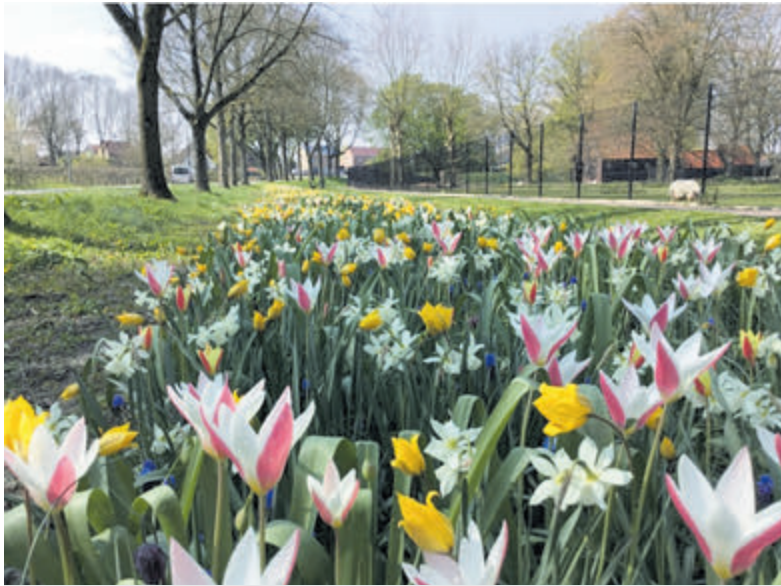
Het bloembollenmengsel.

Santpoort-Noord - Vanaf februari zal de Johan Maurits van Nassaulaan in Santpoort-Noord opgefleurd zijn met een prachtige bloemenpracht.