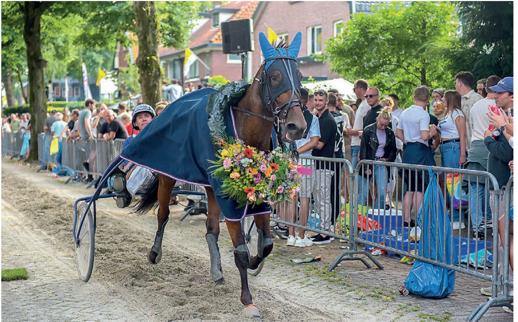
Een van de hoogtepunten was zoals altijd weer de Harddraverij.