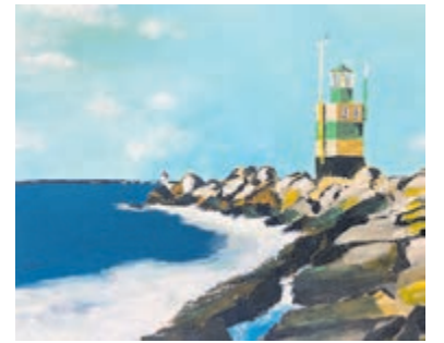
Gedurfd kleuren en zichtbare kwaststreken.

en met 24 september te bezoeken tijdens de openingstijden van Bibliotheek IJmuiden.