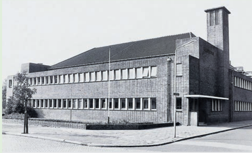
Het Velsersbad aan de Briniostraat gezien in zuidwestelijke richting, in 1978. inv.nr. 8420

Het werk wordt gegund aan de laagste inschrijver, de Haarlemse aannemer A. van Varik. Het metselwerk voor het Velsersbad wordt uitbe-