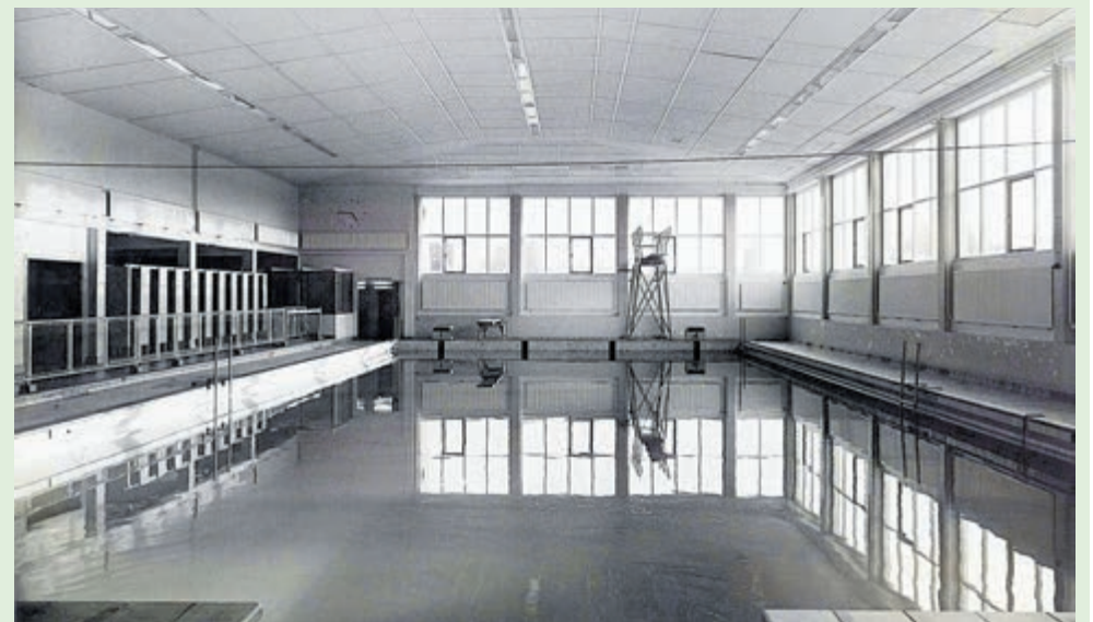
Het gerenoveerde Velsersbad aan de Briniostraat, april 1955. inv.nr. 8411.

In februari 1955 is het Velsersbad weer klaar voor gebruik. Op zaterdagavond 26 februari 1955 wordt het bad tijdens een feestelijke bijeenkomst officieel geopend door burgemeester Kwint. Na zijn openingstoespraak wordt het 'Schaap te water' gelaten, een spectaculaire lichtshow in het water waarbij Velsens gemeenteschaap compleet met van een hoofdrol speelt. Het hele weekend vinden er diverse demonstraties en wedstrijden plaats in het bad.