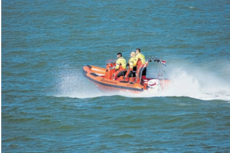
Watervermissing is een zeer serieuze melding.

IJmuiden - De tweede week van de zomervakantie was een week met twee gezichten voor de IJmuider Reddingsbrigade (IJRB). Maandag, dinsdag en woensdag was het mooi weer en redelijk druk op het strand. De rest van de week was het een stuk rustiger. Samen met andere hulpdiensten zijn de lifeguards afgelopen week twee keer in actie gekomen voor een watervermissing.