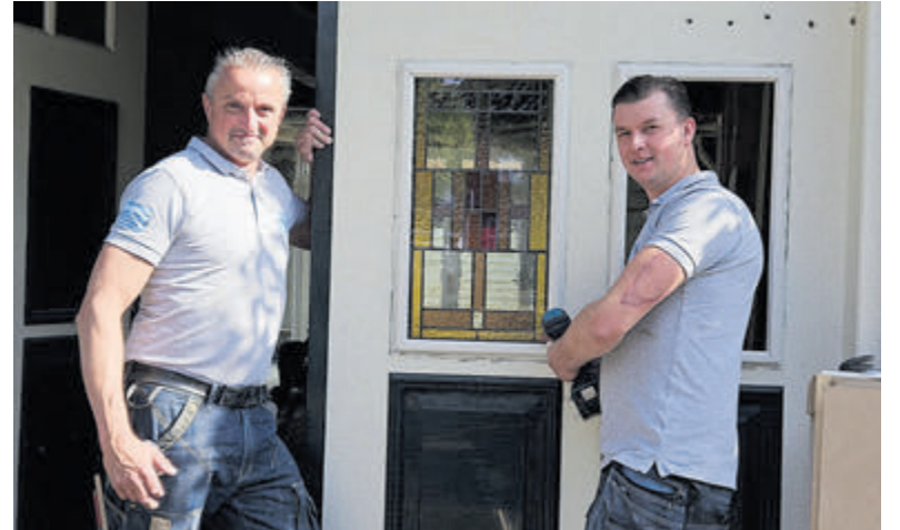
De specialiteit van Bouwbedrijf Bart Thoolen uit Santpoort zijn verbouwingen, zowel binnen- als buitenshuis.

Werken met Bouwbedrijf Bart Thoolen betekent dat er netjes wordt gewerkt. Niet alleen op het project maar ook in de omgeving. Bart weet dat tijdens de verbouwing de klant tijdelijk zijn huis kwijt is en moet delen met het team. „Onze klanten zijn blij als we komen maar nog blijer