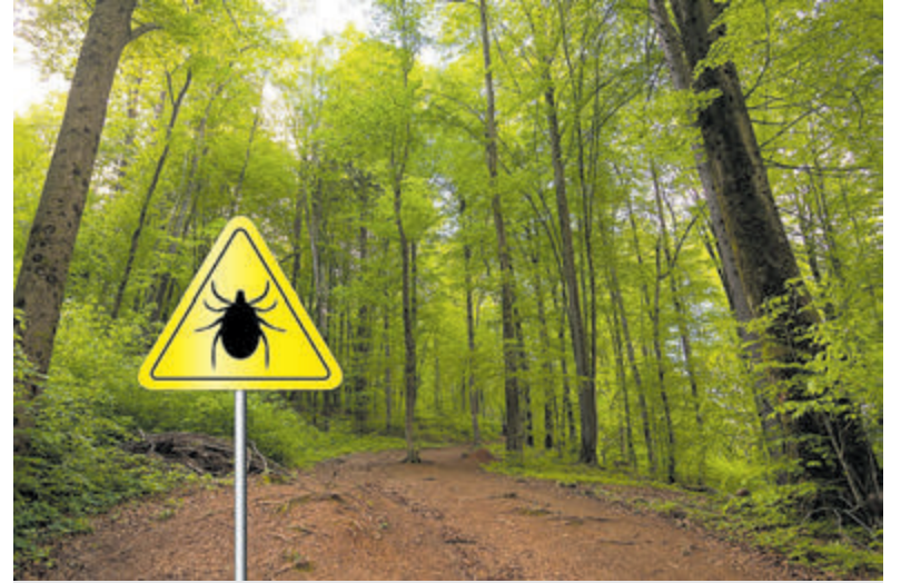
Wees nu extra alert op teken.