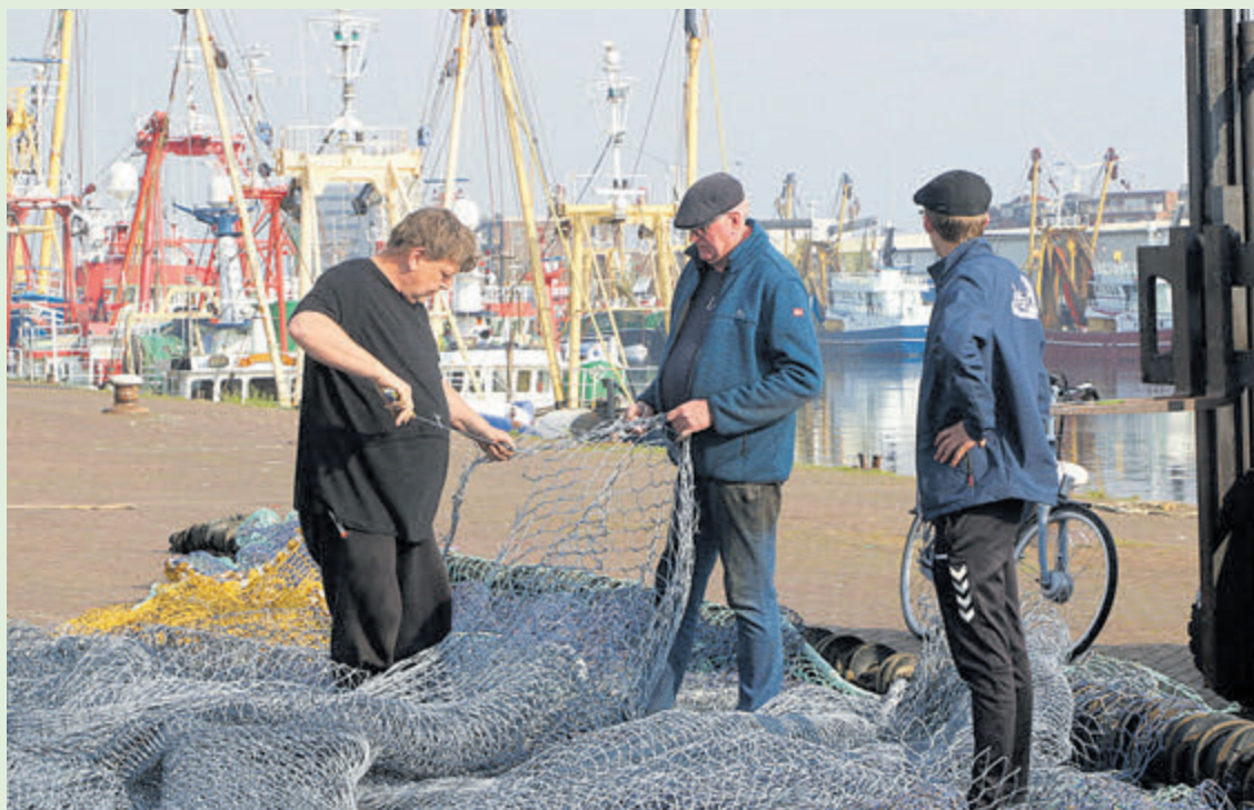
Nettenboeters op de Trawlerkade.