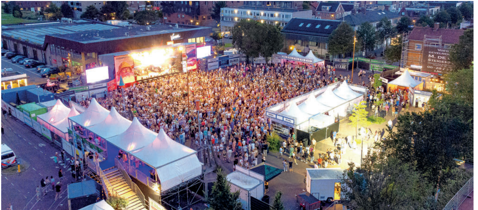
Het is zomer en het is een prachtig festival waarvan optimaal wordt genoten.