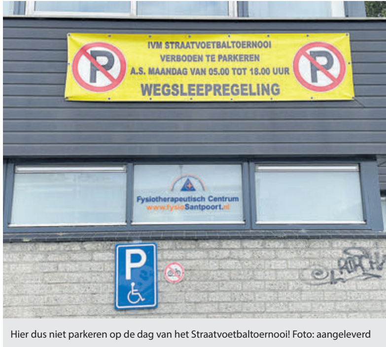
Hier dus niet parkeren op de dag van het Straatvoetbaltoernooi!