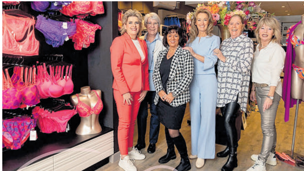
Mega-sale bij Lengerique en kom jij dit leuke team versterken?

Santpoort-Noord - Een van de pareltjes van de Santpoortse Hoofdstraat en een heel prettige, gezellige en vertrouwde speciaalzaak op het gebied van lingerie en badmode. We hebben het over Lengerique natuurlijk.