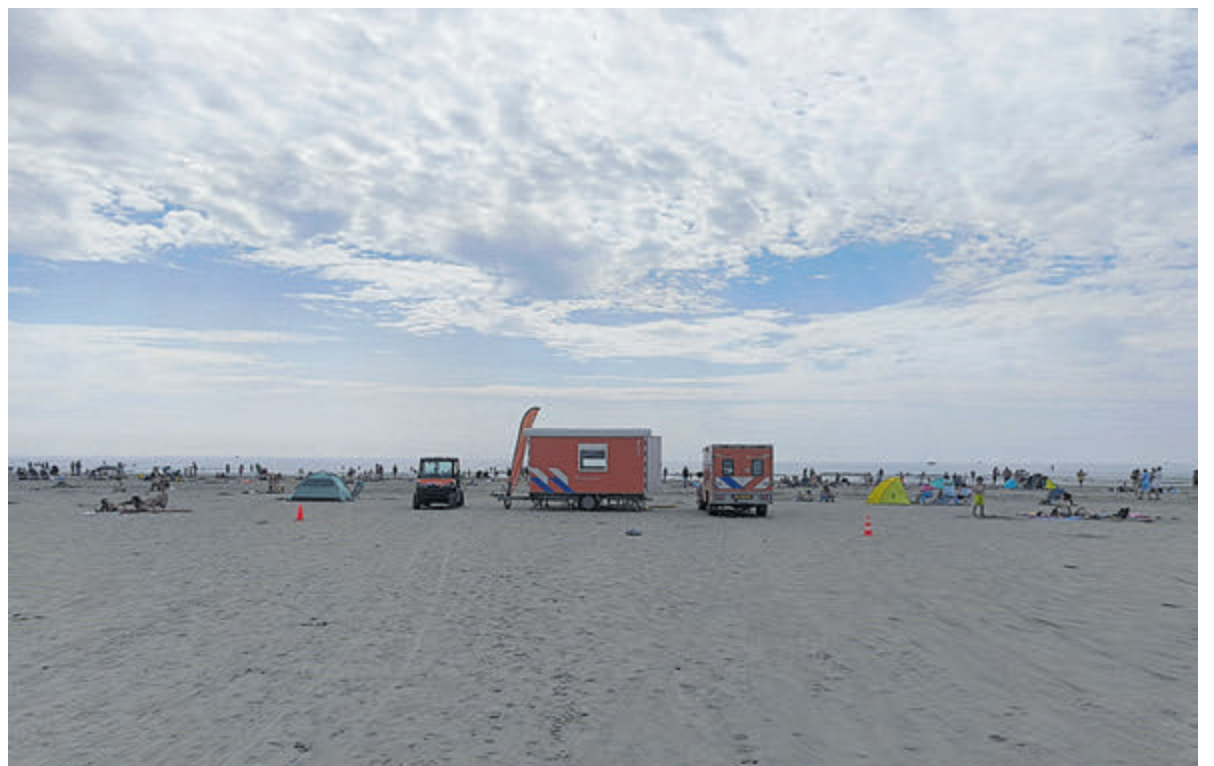
Houd elkaar in de gaten en sla alarm als er iemand in de problemen komt.

Zaterdag was de warmste en daarom ook de drukste dag. In totaal zijn er die dag 52 hulpverleningen verricht. Voornamelijk het verlenen van eerste hulp (40 keer). Maar opvallend genoeg ook tien gevonden kinderen die hun ouders kwijt waren en één vermist kind. In alle gevallen konden ouders/verzorgers weer snel herenigd worden met de kinderen. Voorkom een langdurige vermissing door in eerste instantie goed op elkaar te letten, maar haal ook een gratis 06-polsbandje bij de reddingsbrigade. Wanneer het kind gevonden is kan er hierdoor snel contact worden opgenomen met de ouders/verzorgers.