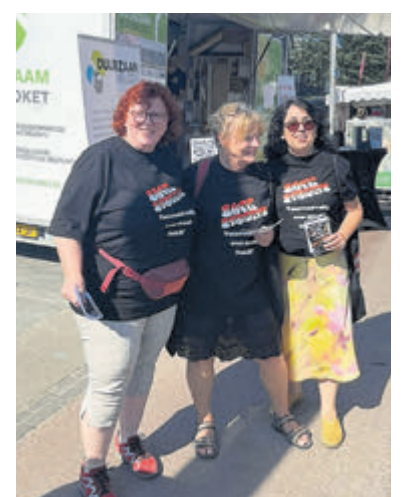
Safe Streets Velsen tijdens het Zomerfestival.

veel klachten van mensen uit de LHBTIQ+ groep en mensen met een beperking. Door middel van flyers, sociale media, onderzoek en preventie probeert Safe Streets de inwoners te attenderen op het feit dat het niet normaal is om vrouwen, meisjes en anderen op een ongewenste manier te benaderen. Vrouwen die toch lastig gevallen worden roepen zij op om dit vooral te melden. Dit kan online bij meld.nl , meldmisdaadanoniem.nl of bij de politie 0900-8844.