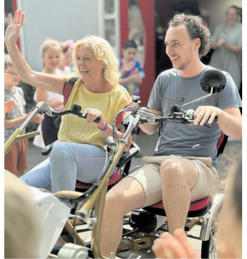
Samen het pensioen in fietsen.

José wordt bedankt voor alle jaren vol inzet en enthousiasme en iedereen wenst haar een fantastisch pensioen toe!