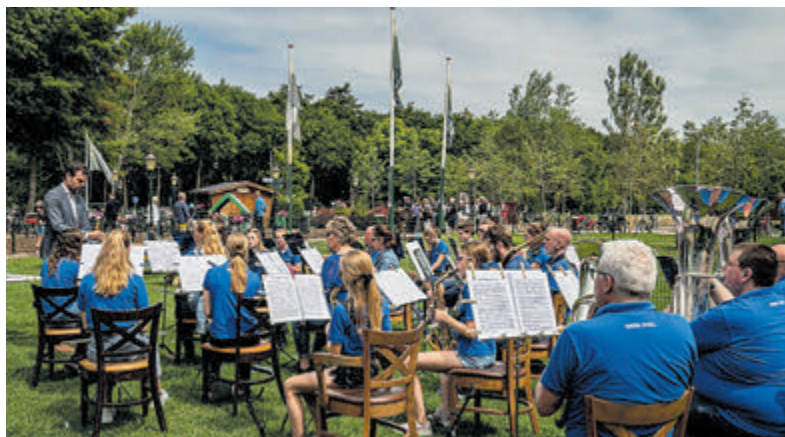
Het Tata Steel Opleidingsorkest.