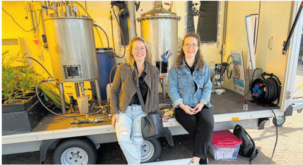
De dames poseren relaxed tussen de hennepplanten en de pillenmachines voor het stadhuis.

IJmuiden - Op zondag 16 juni wordt weer een kofferbakmarkt georganiseerd op Plein 1945. De markt wordt gehouden van 08.00 tot 16.00 uur, aanmelden is niet nodig. Dus heeft u plannen om uw kelder of zolder op te ruimen? Dan heeft u nu de kans om uw overvloedige, bruikbare, spullen te verkopen. Of natuurlijk heerlijk te gaan struinen op zoek naar pareltjes! Mocht u vragen hebben dan kunt u contact opnemen met telefoonnummer 0255 533233 of 06 10475023. De volgende kofferbakmarkten zijn op zaterdag 29 juni, zaterdag 13 juli, zaterdag 27 juli, zondag 4 augustus, zaterdag 24 augustus, zondag 15 september en zaterdag 21 september.