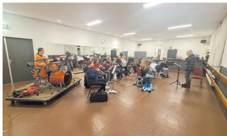
Het opleidingsorkest van Soli.