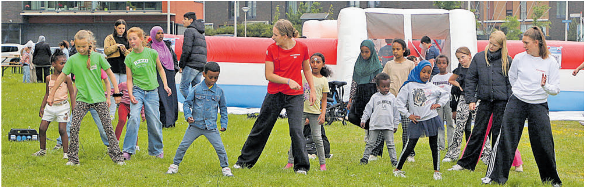
Lekker bewegen met de kinderen uit de buurt.