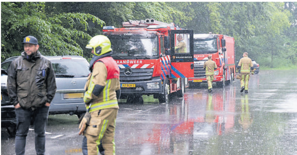
Verdachte vaten aangetroffen bij Kweekensteinsweg.

schip Scombrus afgemeerd ligt. De politie kwam om een plan te maken voor het bergen van het voertuig. Bij het per perse gaan van deze krant was nog niet duidelijk wanneer die berging kan plaatsvinden. Dit hangt af van het moment waarop het vissersschip vertrekt.