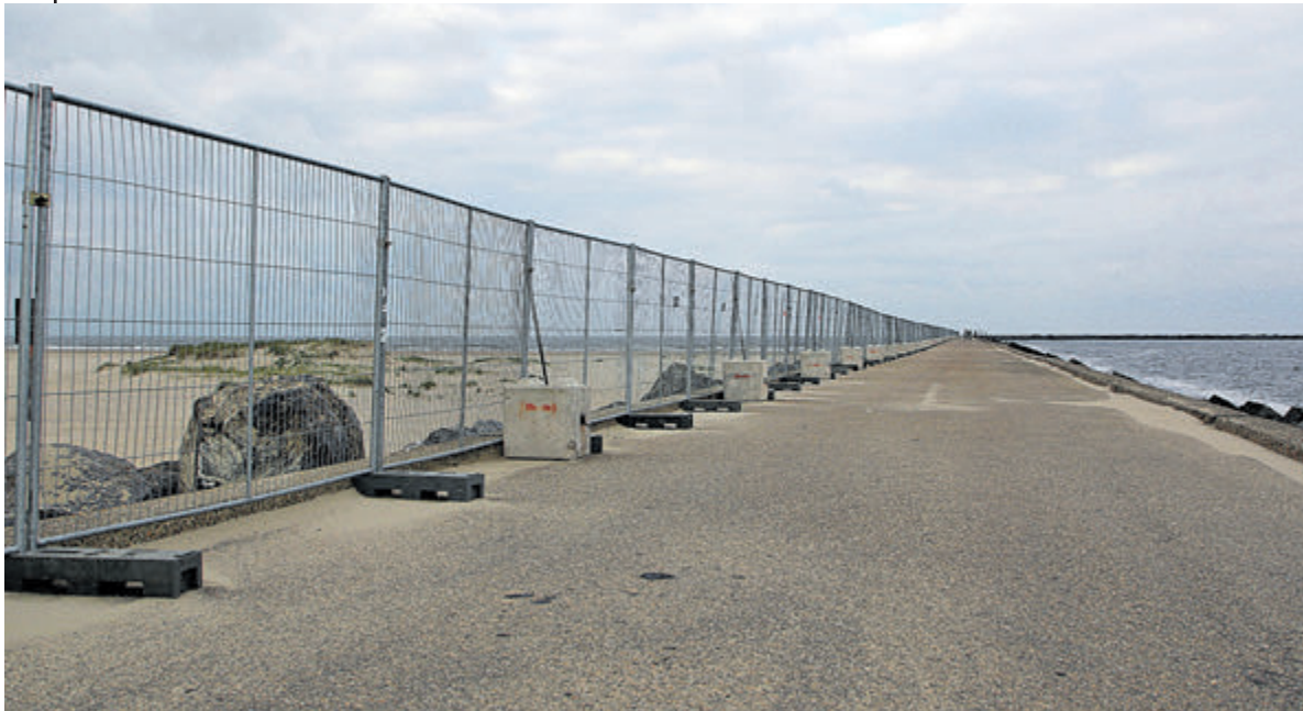
Het ijzeren zomergordijn op de Zuidpier. juni 2024

In deze rubriek staan we stil bij een typisch IJmuidens onderwerp aan de hand van een foto en naar aanleiding van de actualiteit, een stukje geschiedenis, een bijzondere gebeurtenis, een evenement of gewoon een van de mooie taferelen die IJmuiden biedt. In deze aflevering aandacht voor de afsluiting van de Zuidpier tijdens de zomermaanden.