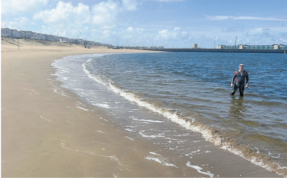
Medeorganisator Maarten-Jasper Brandts op de locatie waar het evenement zal gaan plaatsvinden.