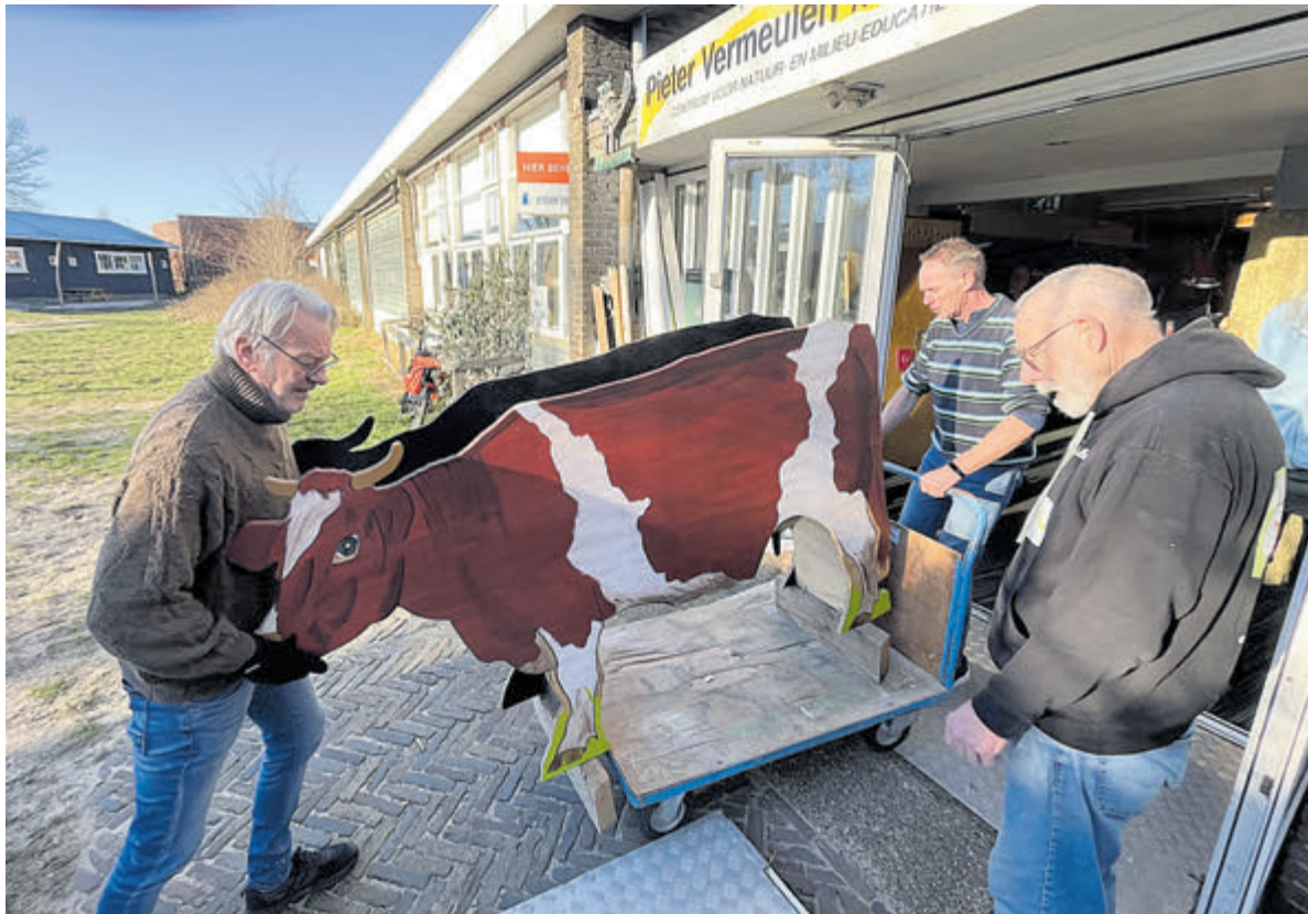
Het opbouwen van de huidige tentoonstelling 'De Groene Toverboerderij'.