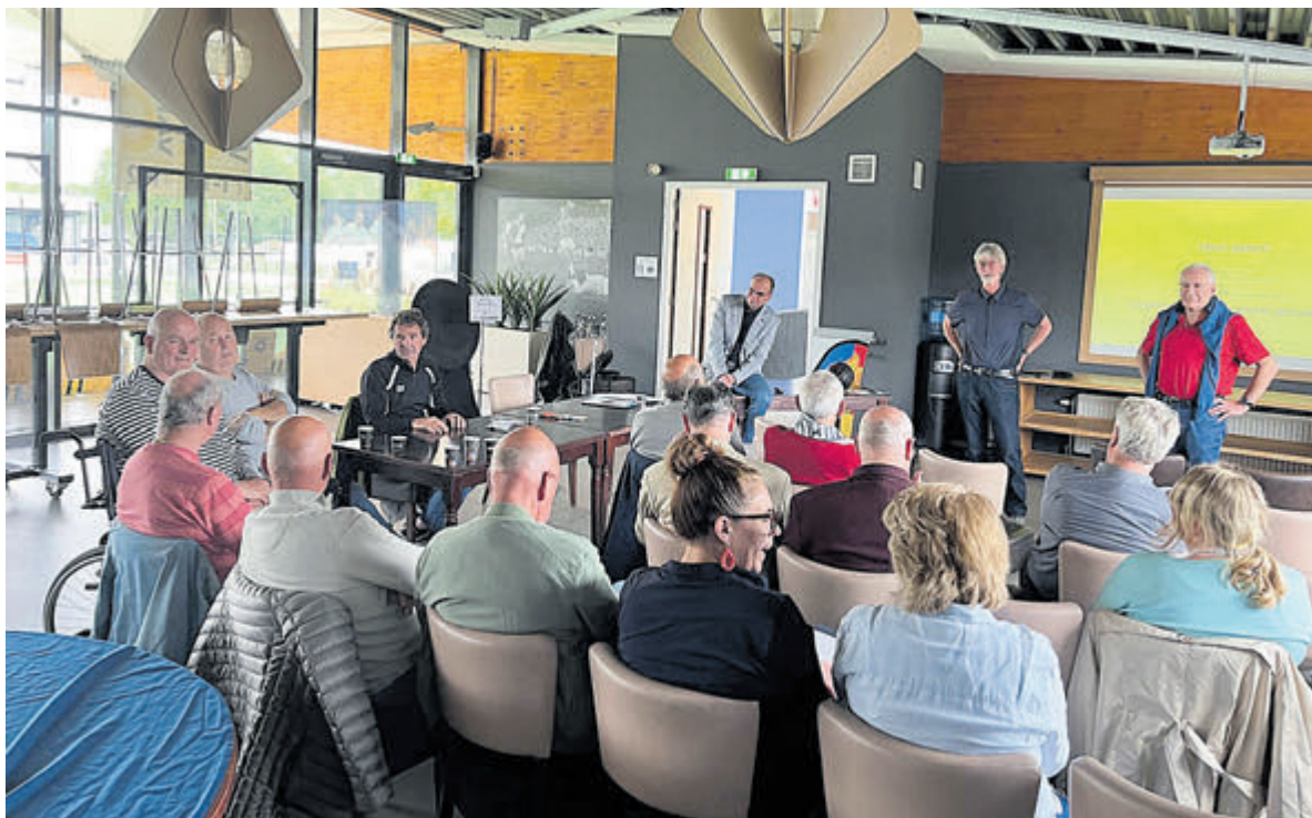
Een nieuwe maandelijkse activiteit die georganiseerd wordt voor ouderen met lichte dementie en eenzame ouderen met een passie voor voetbal.

stellingen, vrijwilligers en belangstellenden werd geopend door Hans