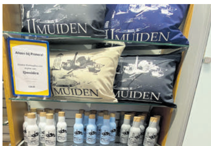
Leuk, die artikelen met de skyline van IJmuiden!