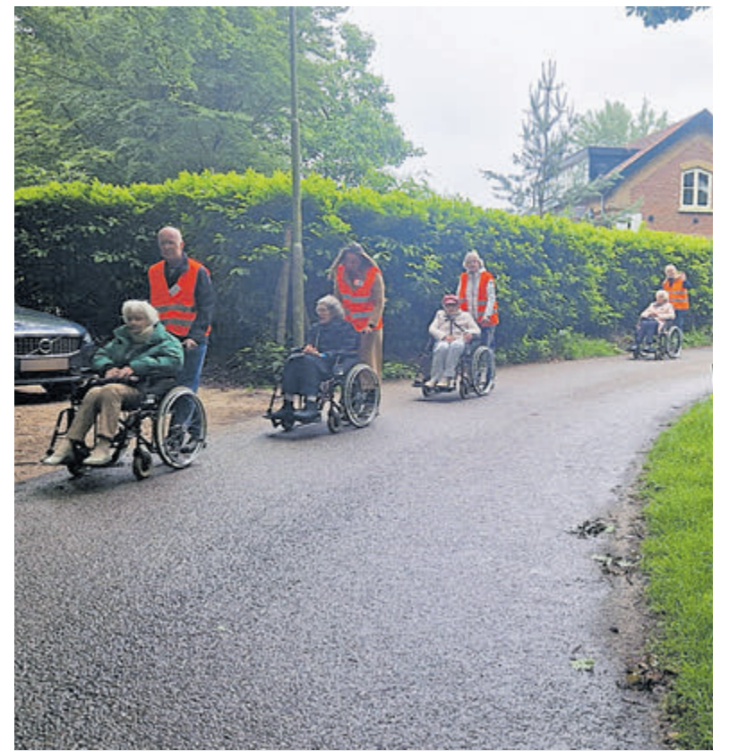
De deelnemers aan de wandeling.

twintig personen geserveerd. Dat was wel fijn, want het was weliswaar droog, maar de kille noordwestenwind maakte het wat fris. De gasten werden onthaald op een kopje koffie, chocolademelk met slagroom of thee met een stuk appeltaart met of zonder slagroom. Dat ging er prima in en er werd flink gesmuld. Terwijl ze daar zaten, brak af en toe de zon door en dan zag alles er direct een stuk vrolijker uit. Na een klein uurtje gezeten, gepraat en gedronken te hebben, werd de terugtocht aanvaard. Rond 16.00 uur was iedereen weer terug bij de recreatiezaal en gingen de deelnemers weer in de OIG-bus om thuisgebracht te worden. Al met al een geslaagde jubileumwandeling, die door een deelnemer werd omschreven als 'prima georganiseerde wandeling'.