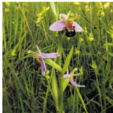
De afgelopen dertig jaar is de bijenorchtis in ons land aan een spectaculaire opmars begonnen.

te winters) speelt hierin waarschijnlijk een belangrijke rol, omdat de plant als rozet overwintert en daarom gevoelig is voor vorst. De bijenorchtis voelt zich thuis op een kalkrijke, vochtige bodem waar zo nu en dan een beetje gerommeld wordt. In de duinen kunnen we haar vinden op plaatsen waar de vegetatie laag en open blijft zoals langs paden, op noordhellingen en in valleien. Ondanks de schitterende bloemen valt de bijenorchtis door haar bescheiden formaat vaak niet op tussen de overige plantengroei. Het is echt een plant waar men op bedacht moet zijn. Je kijkt er zo overheen. De bijenorchtis bloeit omstreeks juni/juli en wordt 20 tot 50 centimeter hoog. Na de bloei gaat de plant in zomerrust en begint in de herfst met het vormen van een nieuw rozet waar-