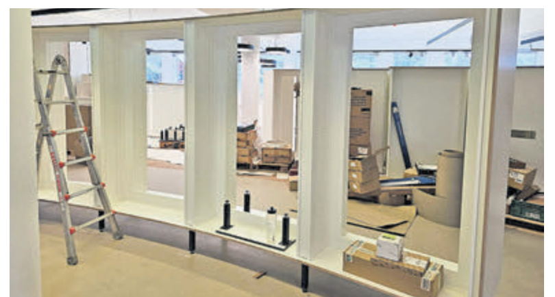
De verbouwing van Bibliotheek Velsersbroek is in volle gang.

In juni en juli is het ook weer tijd voor Zomerlezen. De zomer is perfect om