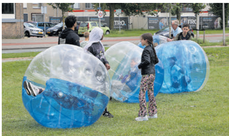
De opblaasballen zijn neen populaire attractie.