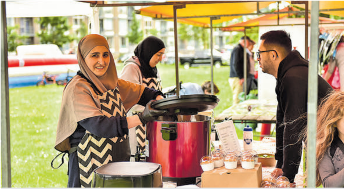
Volop lekkere hapjes en drankjes..