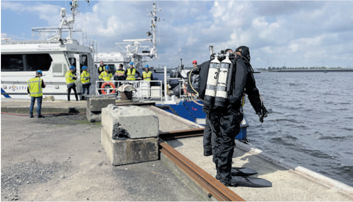
Het duikerdetectiesysteem moet drugscriminelen onder water opsporen.