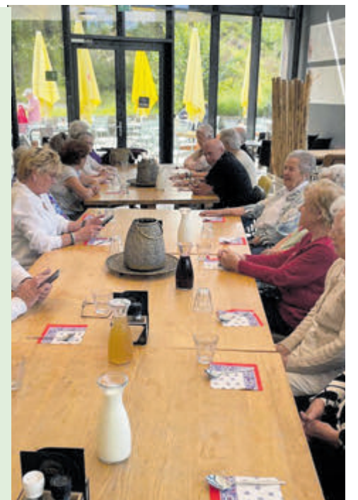
De gasten kunnen terugkijken op een geslaagde dag.

IJmuiden - Afgelopen week is de Zonnebloem IJmuiden west met busjes van de OIG-IHD naar Schoorl gereden. Ze kwamen daar rond 10.00 uur aan. Na de koffie met gebak vertrokken de deelnemers met De Zonnetrein voor een tochtje van anderhalf uur door de Schoorlse duinen. Het was een mooie zonnige dag en de gasten hebben van de tocht genoten. Hierna werd lekker geluncht en enkele gasten hebben nog gewinkeld in de shop bij het restaurant. En vandaar weer huiswaarts.