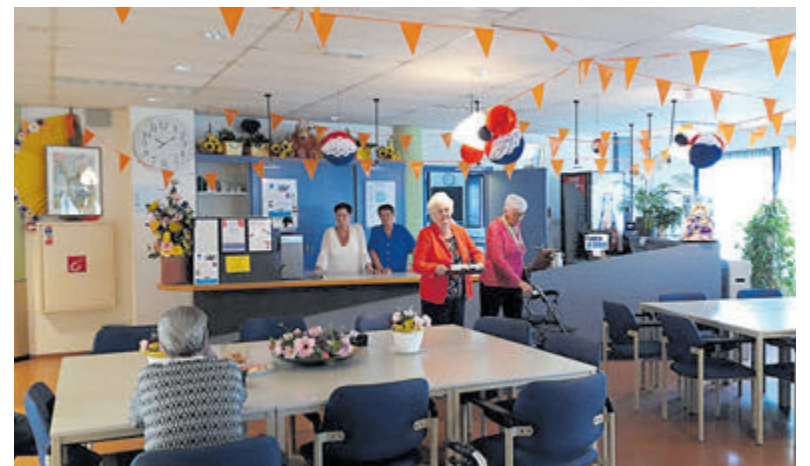
De Hofstede in Velsersbroek is voorbereid op het EK.

De jeu-de-boules-baan in de mooie binnentuin is deze zomer beschikbaar gekomen. Belangstellenden kunnen zich bij de receptie van De Hofstede melden. Inmiddels is de grote zaal in het wijkcentrum oranje gekleurd en voorbereid op het Europees kampioenschap voetbal. Een fijne gelegenheid voor senioren en wijkbewoners om samen, onder het genot van een drankje, naar de wedstrijden van Oranje te kijken. Iedere derde dinsdag van de maand is er een inloopspreekuur (14.00-15.00 uur) voor Velsersbroekers met de wijkagent, de wijkverbinder van de gemeente Velsen, de opbouwwerker van Welzijn Velsen en een medewerker van De Hofstede.