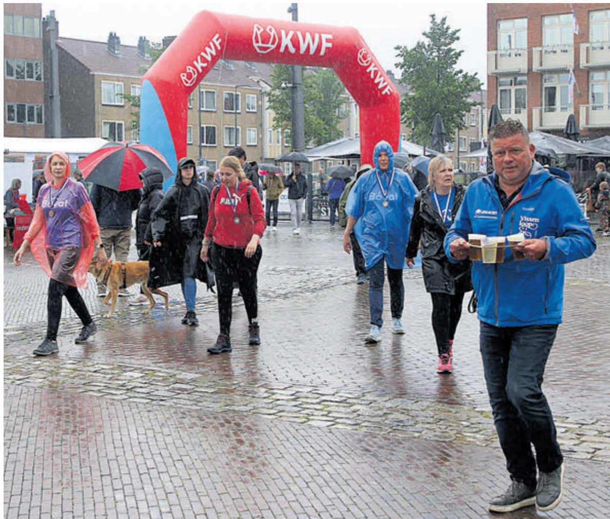
Er blijken dus serieus mensen die onder alle omstandigheden wel een biertje lusten.