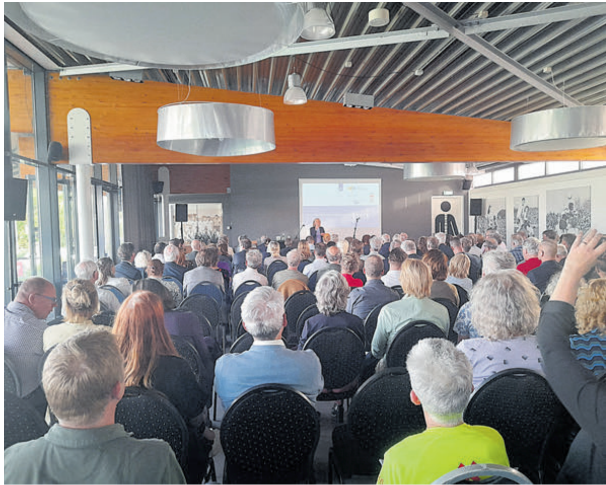
Minister Micky Adriaansens van Economische Zaken en Klimaat (EZK) op de bijeenkomst in het stadion van Telstar.