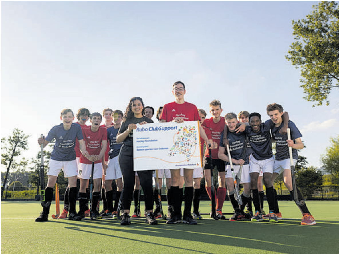
De inschrijfperiode voor clubs is gestart voor de stemcampagne van Rabo ClubSupport.