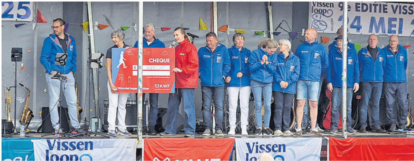
Trots op het feit dat er weer zo'n mooi bedrag is opgehaald en een dik compliment aan organisatie en vrijwilligers.

Wij kunnen u altijd van dienst zijn door onze grote bandenvoorraad