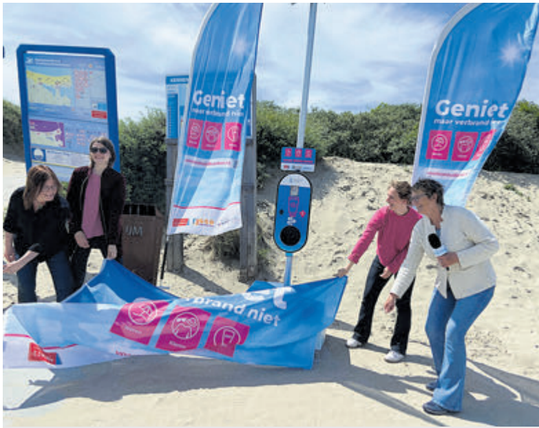
De onthulling, zowaar in een lekker zonnetje' van de smeerpaal.

daarbij aan verkeersregelaars, knippers en vrijwilligers voor hand en spandiensten zoals het klaarzetten van hekken en kraampjes voor de intocht vrijdagavond op het Vestingplein. Mocht je willen helpen, stuur dan een mail naar vrijwilligers@dorpsverenigingvelserbroek.nl . De Avondvierdaagse in Velsersbroek wordt weer een groot feest. Loop je ook mee? Schrijf je dan in via deze link: www.bit.ly/A4D-inschrijving