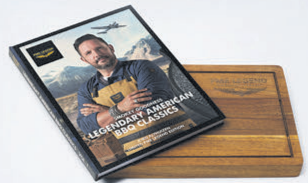
Stoer mannenevent bij Patrick van Keulen.