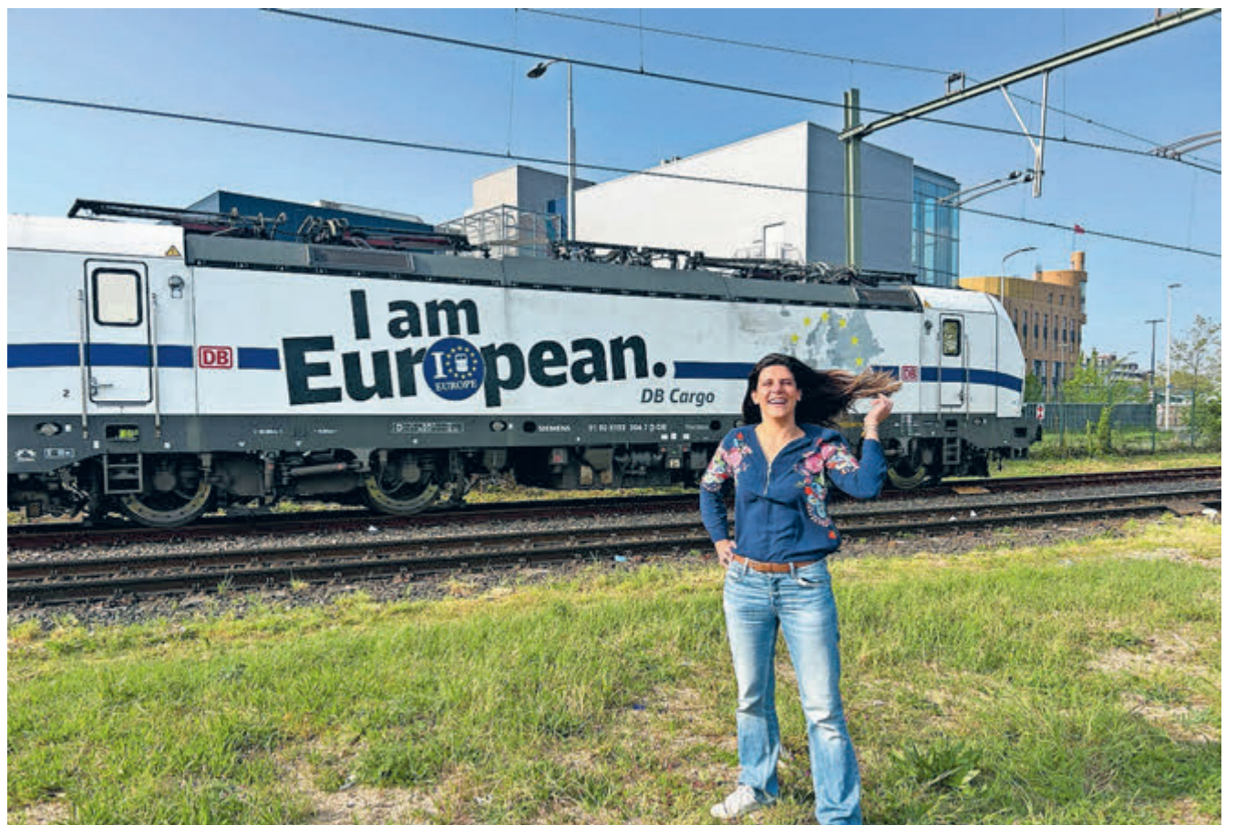
Mbo-studenten kunnen rekenen op Brigitte in Europa. Ze wil zich inzetten voor internationale diploma's, banen in de groene industrie en goedkopere treinen. (FOTO: MEREL WISSENBURG)

Maar niet alleen voor onze economie is Europa belangrijk. Juist zo na 4 en 5 mei staan we extra stil bij het feit dat we in Europa al bijna tachtig jaar in vrede leven. Een verenigd en sterk Europa is in deze onrustige tijden onze beste garantie op vrede, vrijheid en veiligheid voor de toekomst. Van den Berg wil zich