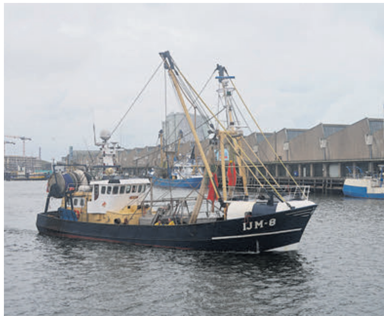
De IJM-8 heeft na op garnalen gevestig te hebben het vizier op andere doelsoorten gericht.