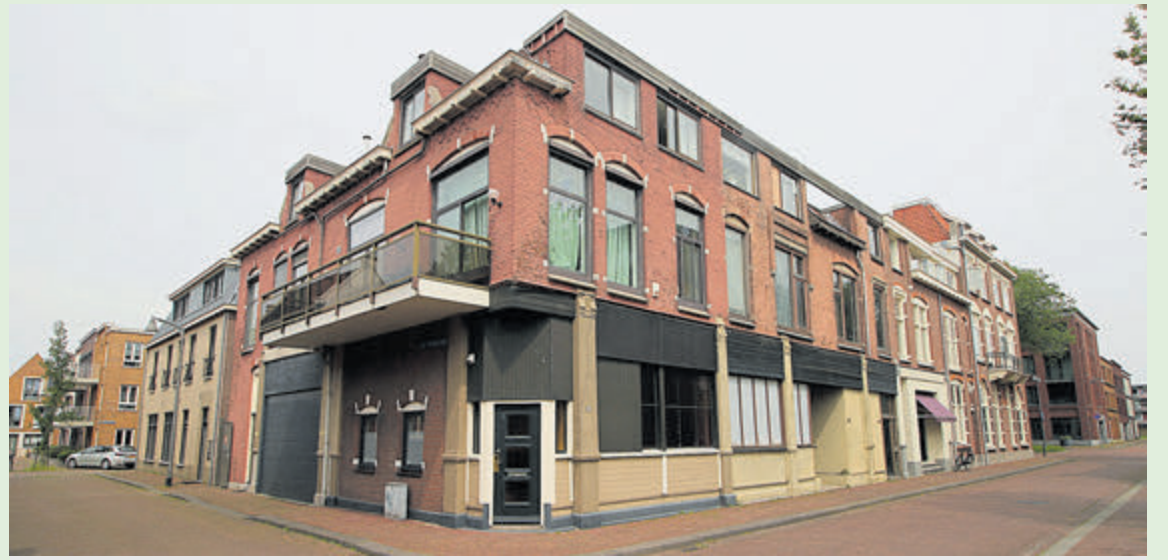
Fotobijlschrift: Het voormalige winkelpand van Gebr. Bischoff op de hoek van de Neptunusstraat en de Van de Pollstraat. Foto: Erik Baalbergen, mei 2024

In deze rubriek staan we stil bij een typisch IJmuidens onderwerp aan de hand van een foto en naar aanleiding van de actualiteit, een stukje geschiedenis, een bijzondere gebeurtenis, een evenement of gewoon een van de mooie taferelen die IJmuiden biedt. In deze aflevering aandacht voor het voormalige warenhuis Gebr. Bischoff aan de Neptunusstraat.