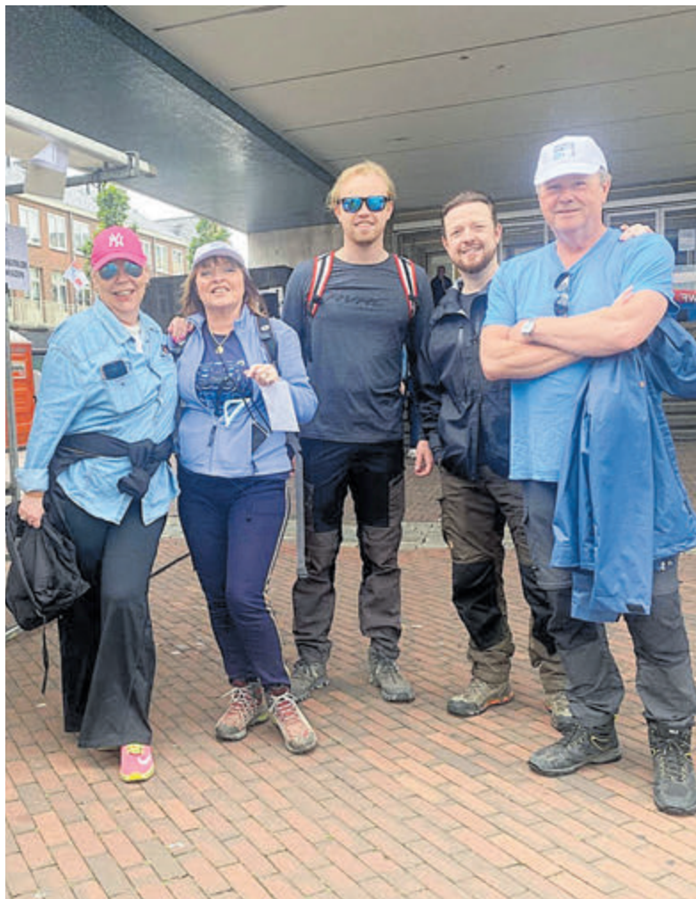
We gingen welgemeend van start om 10 kilometer in toen nog lekker loopweer te lopen. We waren nog geen 500 meter verder en het begon te regenen en dat hield niet op.

Lees het hele verhaal elders in deze krant