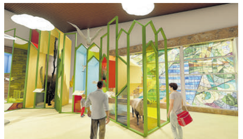
Impressie van de nieuwe locatie van het Pieter Vermeulen Museum.

„De financiering van de aankoop van het pand en het verduurzamen van het gebouw is rond”, aldus directeur Verkaik. „Voor de verduurzaming rekenen we wel op een subsidie van de overheid. Voor het ontwerpen en bouwen van de nieuwe vaste tentoonstelling en het inrichten van de verschillende ruimtes van het nieuwe museum zijn we nog op zoek naar sponsors.