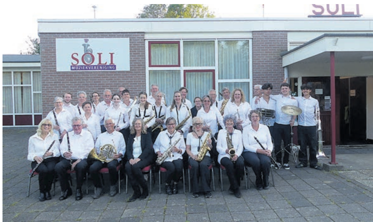
Het Klein Orkest van Soli.

van hun vrijwilligers gecertificeerd om dieren te chippen, onder andere katten, konijnen, cavia's, fretten en hamsters. Overige dieren mogen alleen door een erkende dierenarts worden gedaan. Hier kregen de organisatie veel vragen over want in 2026 wordt het verplicht om katten te laten chippen. Een aantal afspraken zijn reeds gemaakt, ook voor deze dingen is het fijn dat er een open dag is geweest, zodat de bezoekers veel informatie konden inwinnen.