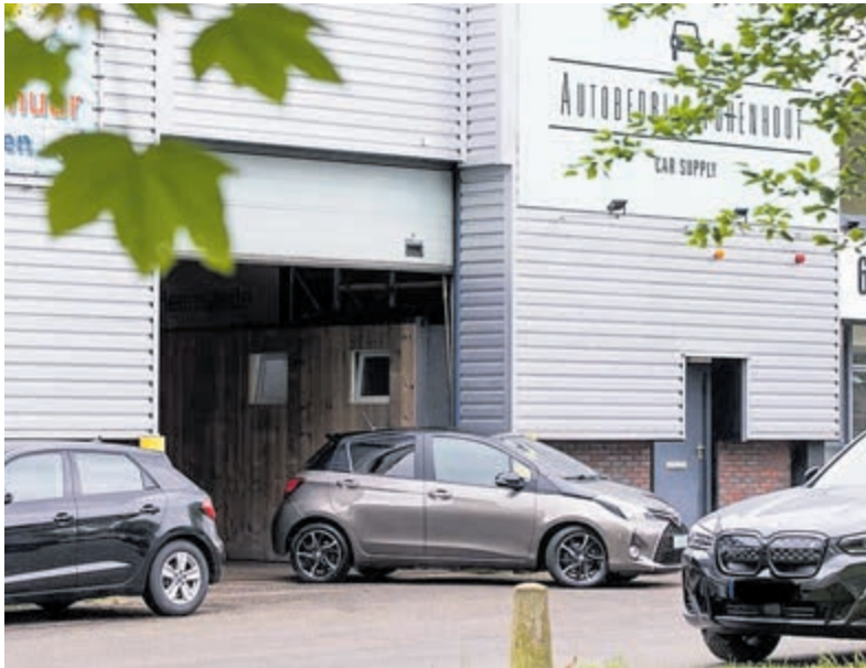
Een paasshow voor het hele gezin bij Turenhout.

Regio - Autobedrijf Turenhout in Heemstede pakt op Tweede Paasdag, maandag 21 april, groots uit. Turenhout organiseert die dag tussen 10.00 en 15.00 uur een paasshow aan de Nijverheidsweg 6.