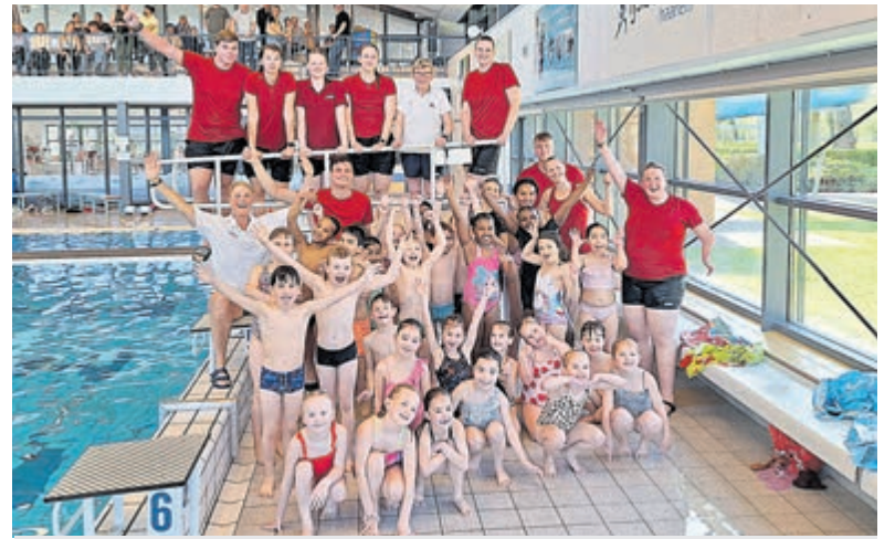
Allemaal van harte gefeliciteerd en veel zwemplezier!

het COA veelal vier asielzoekers in één unit. Het is dus niet zo dat er 200 units komen, maar veel minder. Daarmee is het ook minder omvangrijk dan veel bewoners denken.” Verder speelt mee als positieve factor dat het geen permanente opvang wordt maar maximaal voor 10 jaar. De stichting Samen Santpoort-Zuid zien het liefst een opvang voor maximaal 50 vluchtelingen en ageerde afgelopen jaar stevig. Nadat de gemeenteraad in juni een besluit heeft genomen, komen er nog heel veel gelegenheden en bijeenkomsten om mee te praten.