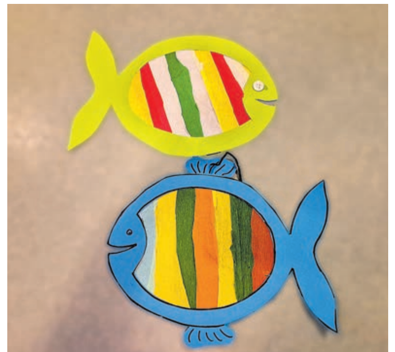
Een kleurrijke vis die in de knutselworkshop wordt gemaakt.

Autobedrijf Turenhout is aangesloten bij BOVAG. BOVAG staat voor betrouwbaarheid, garantie en kwaliteit.