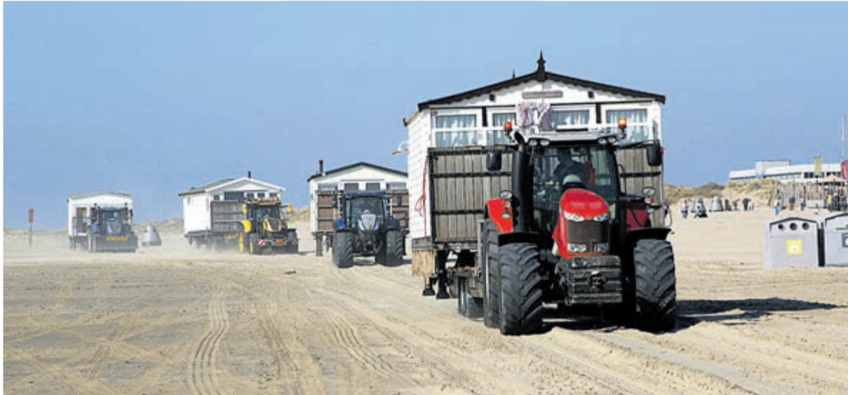
Twee keer per jaar worden de huisjes verplaatst.