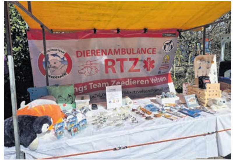
RTZ-Velsen met een kraam op de open dag van het Kerbert Dierentehuis.

Bestellen van kaarten kan online via www.haventheaterijmuiden.nl , telefonisch tel. 0900-1505 (ma t/m zo 11.00 - 20.00 uur, 0,45 p/m) en aan de theaterbalie tijdens openingstijden van het theater. Of mail naar info@haventheaterijmuiden.nl . Locatie: Haventheater IJmuiden, Dokweg 43-45, 1976 CA, IJmuiden.