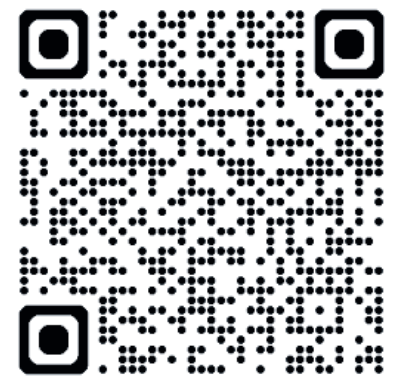
QR code website gemeenteraad www.velsen.nl/gemeenteraad