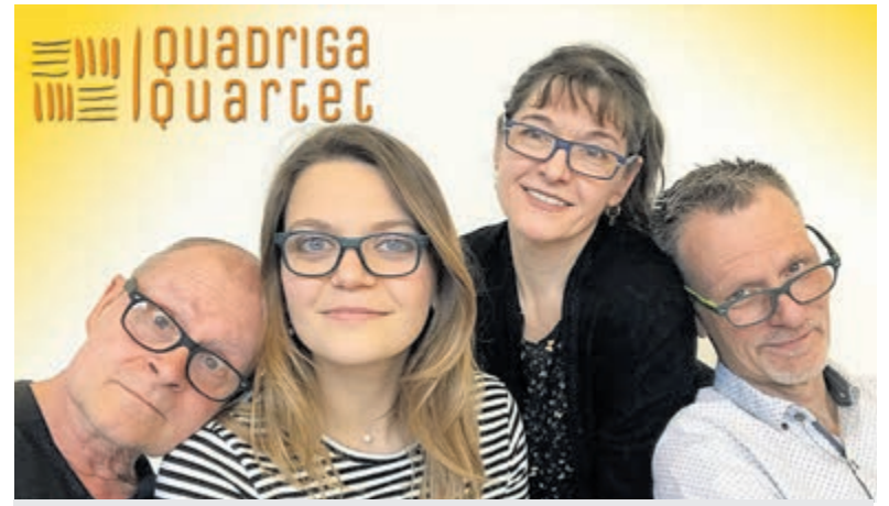
Kwartet Quadriga.

Speciaal ter gelegenheid van 80 jaar bevrijding organiseert het Hoogovensmuseum van 19 april tot en met 15 mei 2025 een indrukwekkende tentoonstelling over de Tweede Wereldoorlog waar de verhalen uit het boek een centrale plaats krijgen. Het museum is open op woensdag, zaterdag en zondag van 10.30 tot 16.00 uur met een laatste entree om 15.00 uur. Adres: Wenkebachstraat 1 in Velsen-Noord.