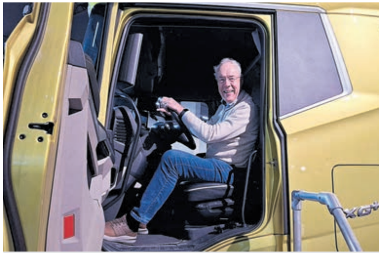
De excursie naar het DAF Museum.

Velsen - De Kennemer Sociëteit is ruim 37 jaar geleden als zelfstandige vereniging opgericht. Het is een actieve vereniging met 69 leden, die als doel heeft om een informeel en ontspannen ontmoetingspunt te zijn voor personen die een werkzaam leven achter de rug hebben en openstaan voor de veranderingen in de maatschappij.