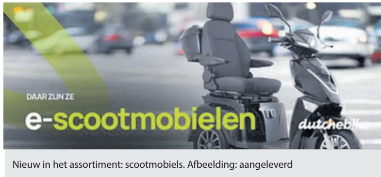
Nieuw in het assortiment: scootmobielen.

IJmuiden - Goed nieuws! Vakgarage Koelemeijer heeft het assortiment uitgebreid met een nieuwe e-mobiliteit categorie: scootmobielen. Een comfortabele en betrouwbare oplossing voor mensen die graag mobiel willen zijn en blijven.