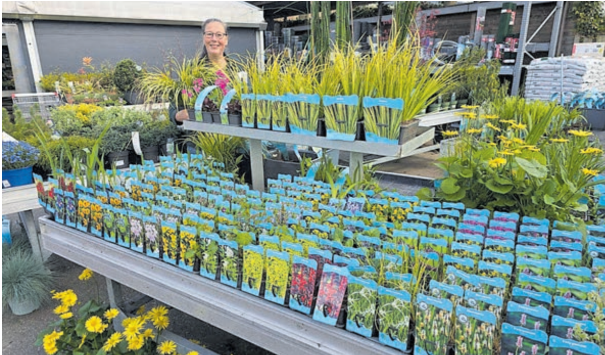
Gratis je vijverwater laten analyseren.