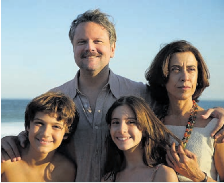
I'm Still Here.