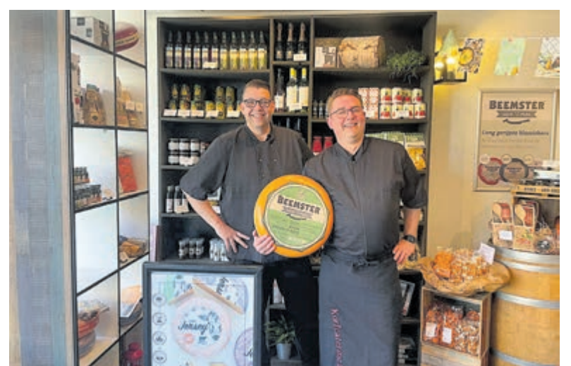
Bij Korf Catering weten ze wel wat lekker en gemakkelijk is.

Op Eerste Paasdag zijn ze extra geopend voor het afhalen van schalen voor de paasbrunch of paasborrel. Bestellen kan via de webshop www.korf catering.nl .