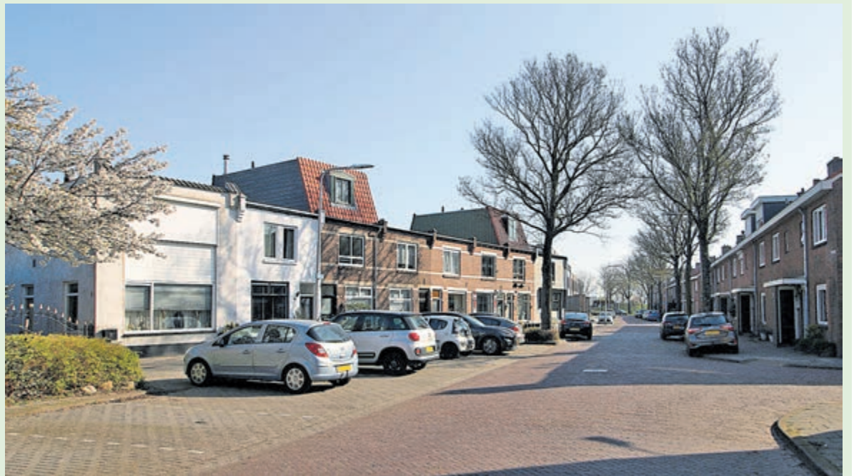
De Lagersstraat is een van de op de grens van een schietoorden gelegen straten waar ook nu nog het verschil in huizen van voor (links) en na (rechts) de Tweede Wereldoorlog duidelijk zichtbaar is. Foto: Erik Baalbergen, 2025

jestraat in Oud-IJmuiden. Een ander deel is een brede strook rond het vooroorlogse Kennemerplein, tussen het kanaal in het noorden en de duinen in het zuiden. Bij de wederopbouw worden hier onder meer het Van Poptaplantsoen en Moerbergplantsoen aangelegd. Een derde deel is een brede strook tussen de Kalverstraat en Willemsbeekweg, van de Frans Halsstraat tot de Velserspoorbrug.