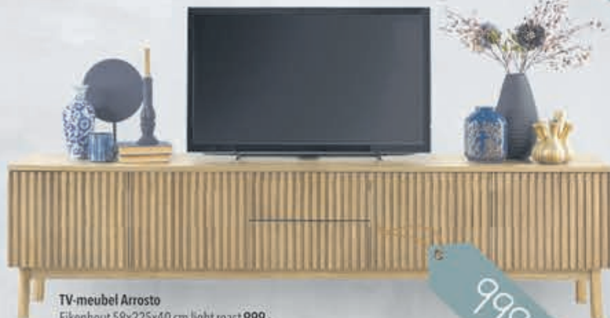
TV-meubel Arrostto Eikenhout 58x225x40 cm light roast 999,-