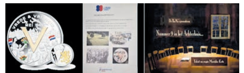
Een toneelstuk over de helpers van de bewoners van het Achterhuis.

Maandag 14 april, aanvang 20.00 uur, zaal open 19:30 uur. Adres: Zee- & Haven Museum, Havenkade 55 IJmuiden. De toegang is gratis voor leden van de Historische Kring Velsen. Niet-leden wordt een bijdrage van 5 euro gevraagd. Aanmelden is verplicht en kan via de website: www.historischekringvelsen.nl .