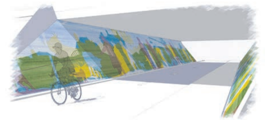
Schetsontwerp Velsertaverse Rosa Everts

• Maandag 5 mei Bevrijdingsdag Gemeentehuis gesloten • Vrijdag 9 mei Interne bijeenkomst Vanaf 16.00 uur gemeentehuis gesloten • Donderdag 29 mei Hemelvaartsdag Gemeentehuis gesloten • Vrijdag 30 mei Brugdag Gemeentehuis gesloten