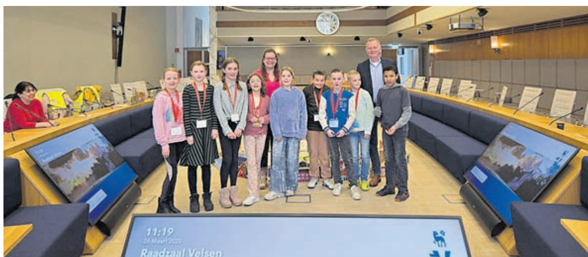
In de gemeenteraad zitten is toch best een moeilijke baan.

strand tussen de Kennemerboulevard en de IJmuiderslag. De huisjes van de Strandvereniging IJmuiderstrand (SVIJS) staan op het kleine strand, tussen de Zuidpier en de strekdam. Gedurende de wintermaanden staan de huisjes beschermd tegen storm en hoogwater opgeslagen op de winterstallingen, op de grote parkeerplaats bij de IJmuiderslag en op een terrein bij de IJmondhaven. Twee keer per jaar vinden dus grote verhuizingen plaats. (Bron: Typisch IJmuiden, Erik Baalbergen 11 april 2021)