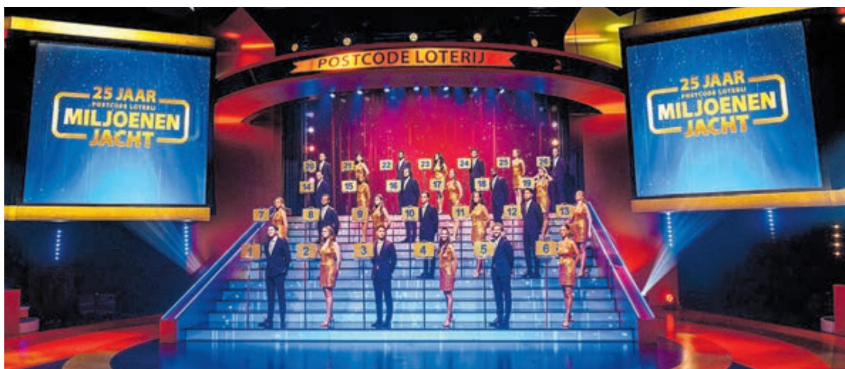
De uitzending van Postcode Loterij Miljoenenjacht met daarin de inwoners van IJmuiden is zondag 13 april vanaf 19.55 uur te zien bij SBS6.