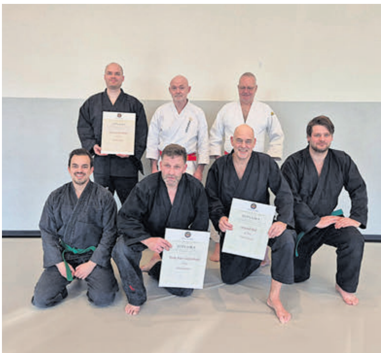
Er is veel en hard getraind voor dit examen.

Santpoort - Zondag was een prachtige dag bij de Dojo van de Santpoortse Sportvereniging Dschen Dui aan de Wüstelaan. Niet alleen de zon straalde op deze mooie winterse dag, ook binnen straalden de kandidaten met indrukwekkende technieken tijdens de dan-examens in de Jiu Jitsu discipline.