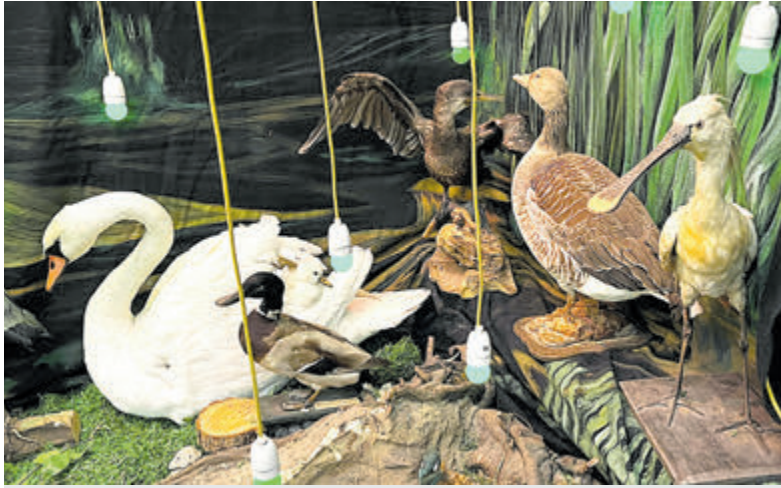
De nieuwe tentoonstelling 'Kletsnat'.