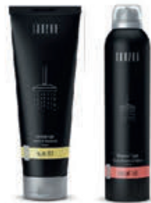
Janzen Compleet assortiment