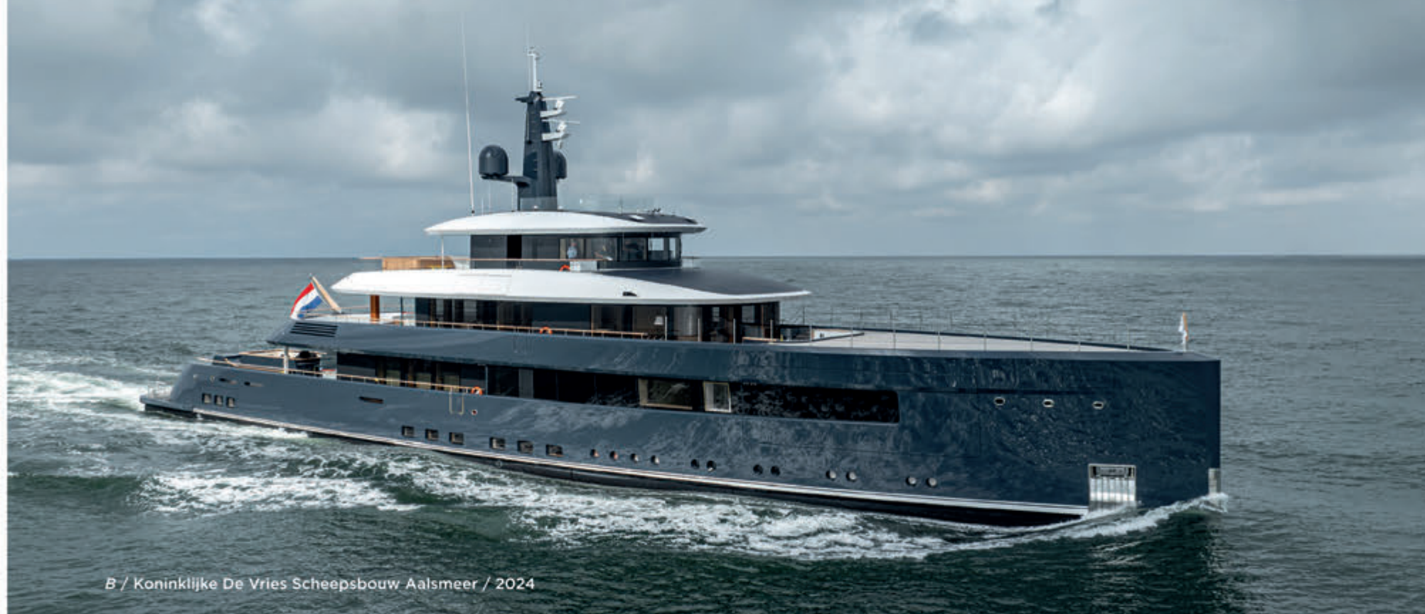
B / Koninklijke De Vries Scheepsbouw Aalsmeer / 2024

Bij Koninklijke De Vries Scheepsbouw in Aalsmeer bouwen we met ongeveer 500 medewerkers superjachten onder de merknaam Feadship. Ieder jacht is custom built volgens de wensen van de eigenaar. We bouwen in Aalsmeer de casco's van 40 tot 80 meter lengte af tot luxe jachten die zich onderscheiden