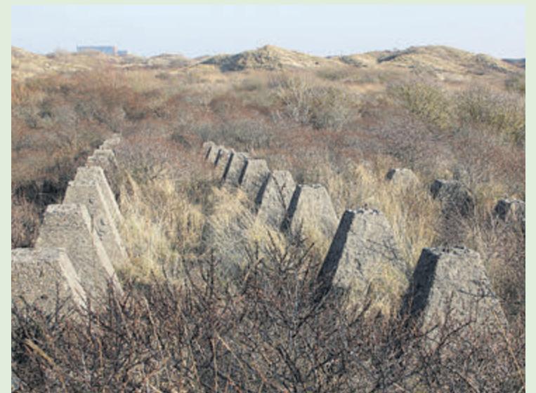
Stukje drakentandversperring in de IJmuidense duinen bij IJmuiderslag.

Een aantal drakentanden rond IJmuiden hebben de tand des tijds en sloop overleefd. Zo kunnen we ze nog steeds zien aan de westkant van het Forteiland en in de toegankelijke duinen bij de IJmuiderslag. Vanuit de verte en op luchtfoto's zijn ook rijen drakentanden in het afgesloten duingebied ten zuiden van de Heerenduweg te zien. Sommige stukken in de duinen zijn behoorlijk overwoekerd door struikgewas. Misschien kan een drakentandarts of drakengebitsverzorger ze 'ns een drakentandsteenbehandeling geven?