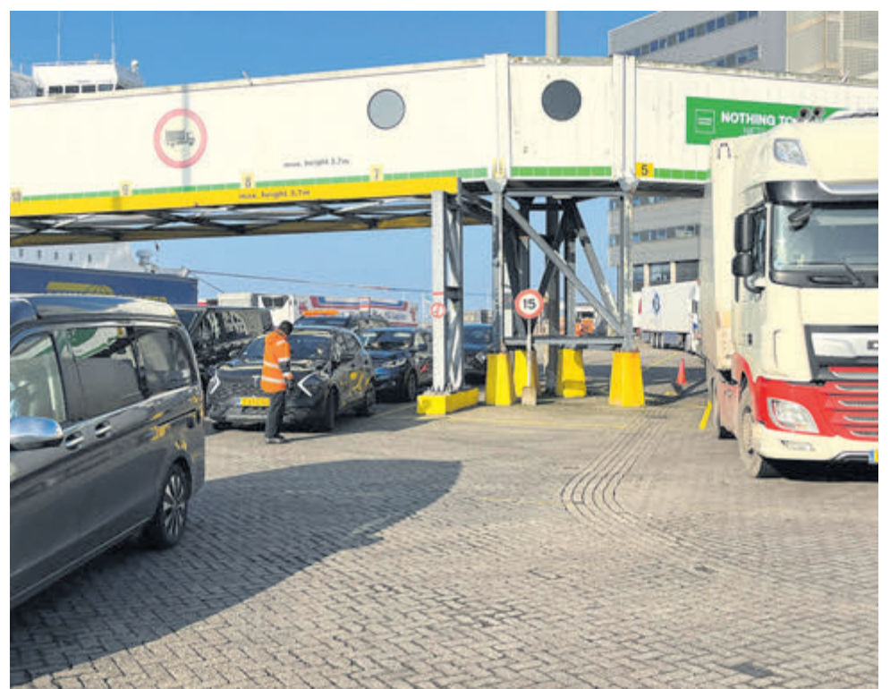
■ Dit is echt een leuke buitenbaan en heel afwisselend.