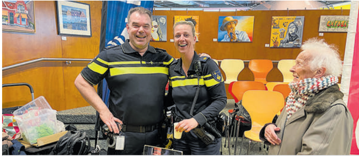
Vooraf bij de stand van de politie was het heel druk. En gelukkig maar want voorkomen is beter dan genezen.