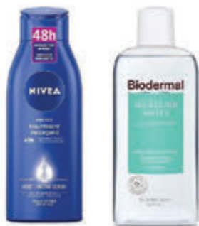
Nivea & Biodermal Compleet assortiment