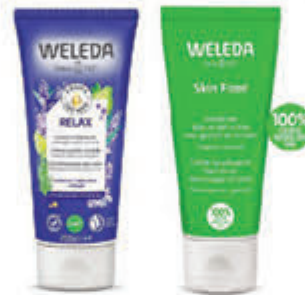
Weleda Compleet assortiment