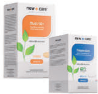
New Care Compleet assortiment

Alkmaar · Bergen · Beverwijk · Castricum · Heemskerk · Santpoort-Noord · Uitgeest · Wormerveer