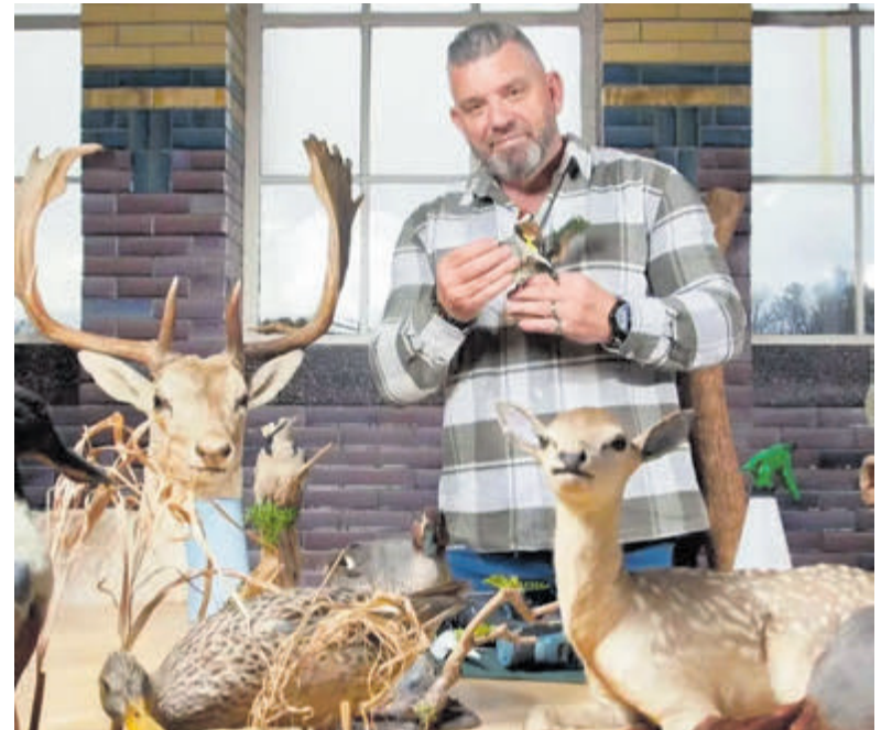
In de werkplaats komen natuur en precisie samen.

De Santpoortse Sportvereniging Dschen Dui biedt meerdere martial art disciplines aan; Jiu Jitsu, Pencak Silat, Karate, Hatha Yoga, Chi Neng Qigong, Tai Chi en Taekwon-Do. Dschen Dui heeft een prachtige oefenzaal (Dojo) in het historische schoolgebouw aan de Wüstelaan in Santpoort. Als vereniging met vrijwilligers kunnen ze de contributie laag houden en staan naast sportiviteit ook plezier, leren van elkaar, gezelligheid en een veilige beoefening bij ons centraal. Kijk op de website www.dschenlui.nl , kom langs om te kijken of volg gratis proeflessen.