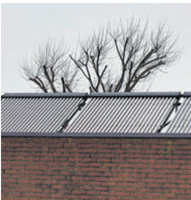
Zonnecollectoren op het dak zorgen voor opwarming van het water.

IJmuiden - De IJmuidense voetbalclub Stormvogels is de laatste jaren flink aan het investeren in de accommodatie. De op zichzelf al prachtig gelegen en goed onderhouden velden liggen er steeds beter bij. En ook binnen en buiten de gebouwen wordt flink doorgepakt.