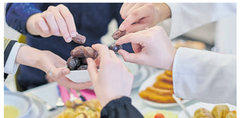
Het avondprogramma start na zonsondergang met een gezamenlijke Iftar-maaltijd.