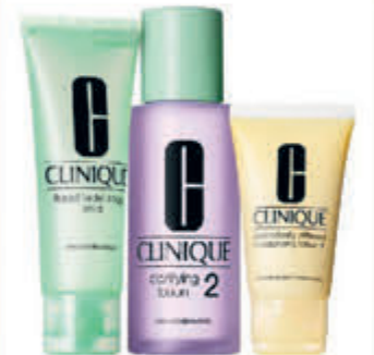
Clinique Compleet assortiment