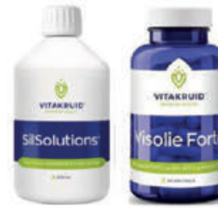
Vitakruid Compleet assortiment