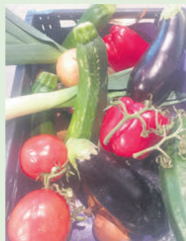
Aubergines, courgettes, fetakaas, olijven, gevulde druivenbladeren waren in die tijd in Nederland nog onbekend.