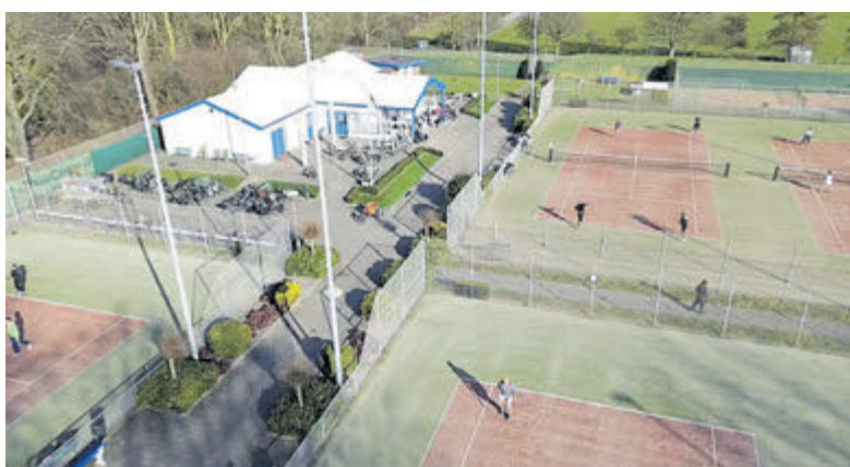
In ieder geval veel gezelligheid en sportiviteit op het prachtige tennispark.

Velsen-Noord - Van vrijdag 21 maart tot en met zondag 30 maart wordt het dertiende Gieteling Open gespeeld. Alleen tennissen, want padel is er niet op het prachtige park.