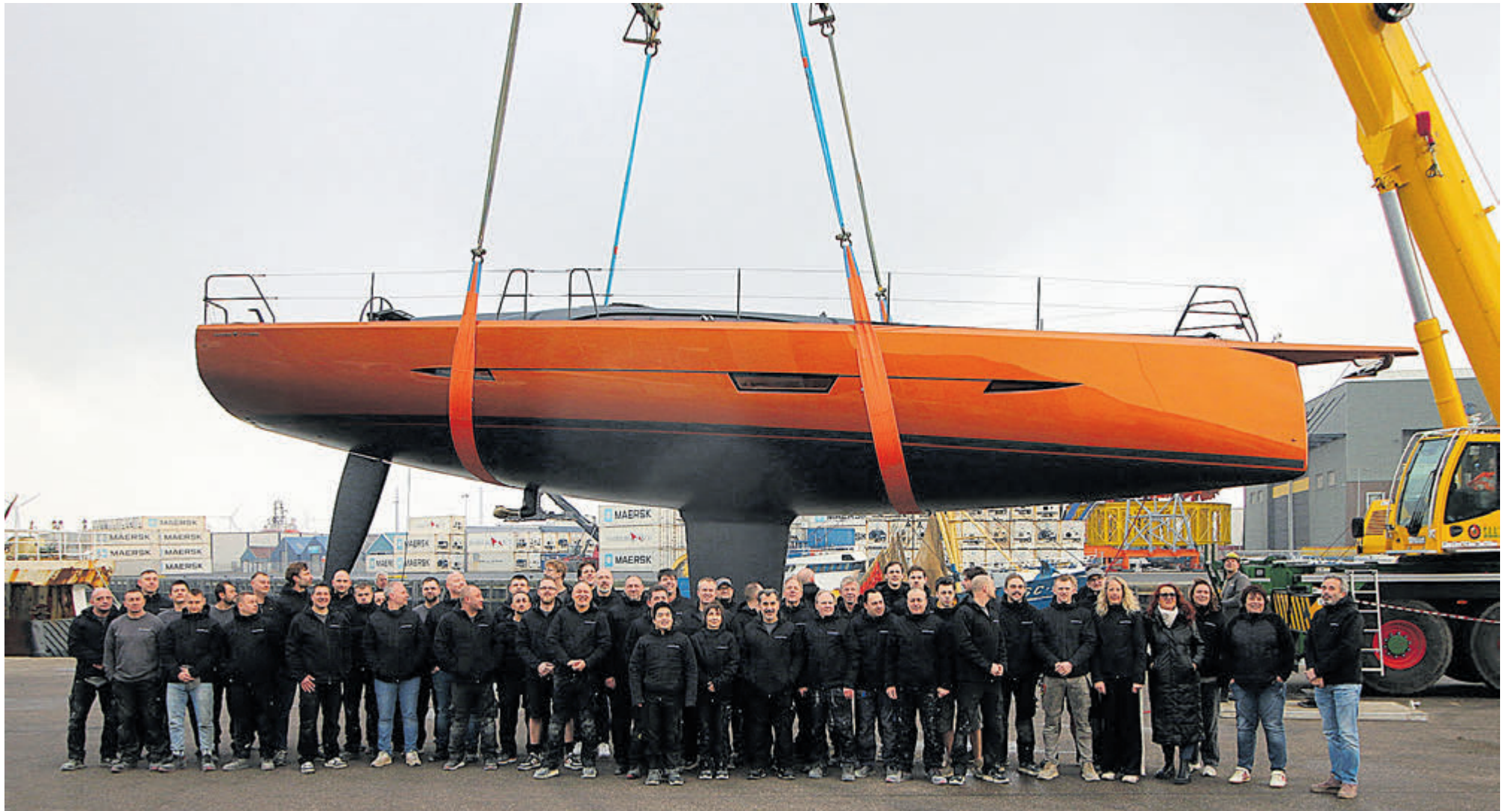
De tewaterlating van de gloednieuwe Saffier SL 46 trok enorm veel belangstelling.