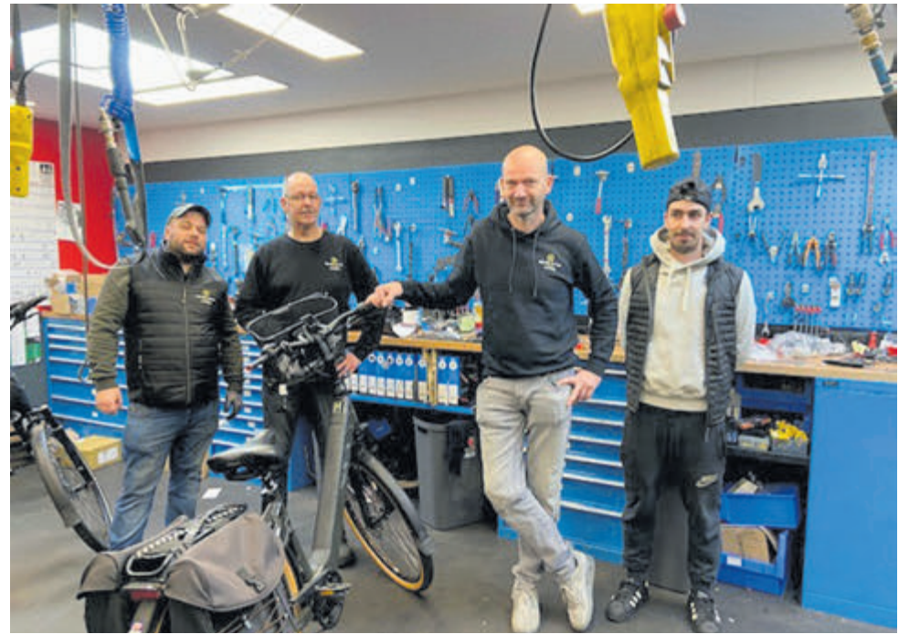
■ Een paar mannen hebben even de tijd om voor de foto te poseren in de werkplaats van Donker.

De werkplaats chef is natuurlijk de spil van de werkplaats van Bike Totaal Donker. Diegene die ervoor zorgt dat de werkzaamheden soepel verlopen, de kwaliteit bewaakt wordt en je begeleidt de monteurs en ook de stagiaires. Je hebt de zogenaamde 'helicopterview' en houdt overzicht, maakt plannings en zorgt dat de klanten optimale service en kwaliteit krijgen. Daarvoor moet je wel ervaring hebben als fietsenmonteur en technisch sterk zijn. Je denkt in oplossingen en vindt het leuk om met klanten om te gaan. E-bikes hebben natuurlijk ook geen geheimen voor je. Er staat trouwens een gezellige 'stamtafel' in de zaak waar de koffie prima is dus 'even wachten', als dat nodig is, zal geen probleem zijn voor de meeste mensen Bike Total Donker zit aan het Marktpllein in een levendige