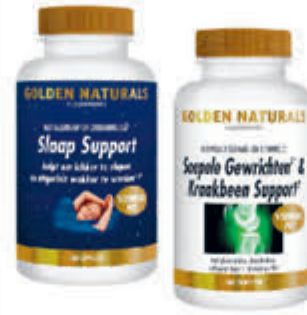
Golden Naturals Compleet assortiment