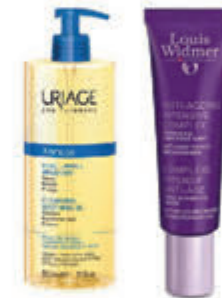
Uriage & Louis Widmer Compleet assortiment