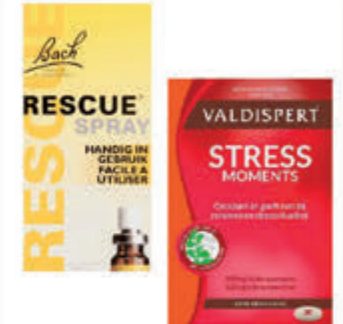
Bach & Valdispert