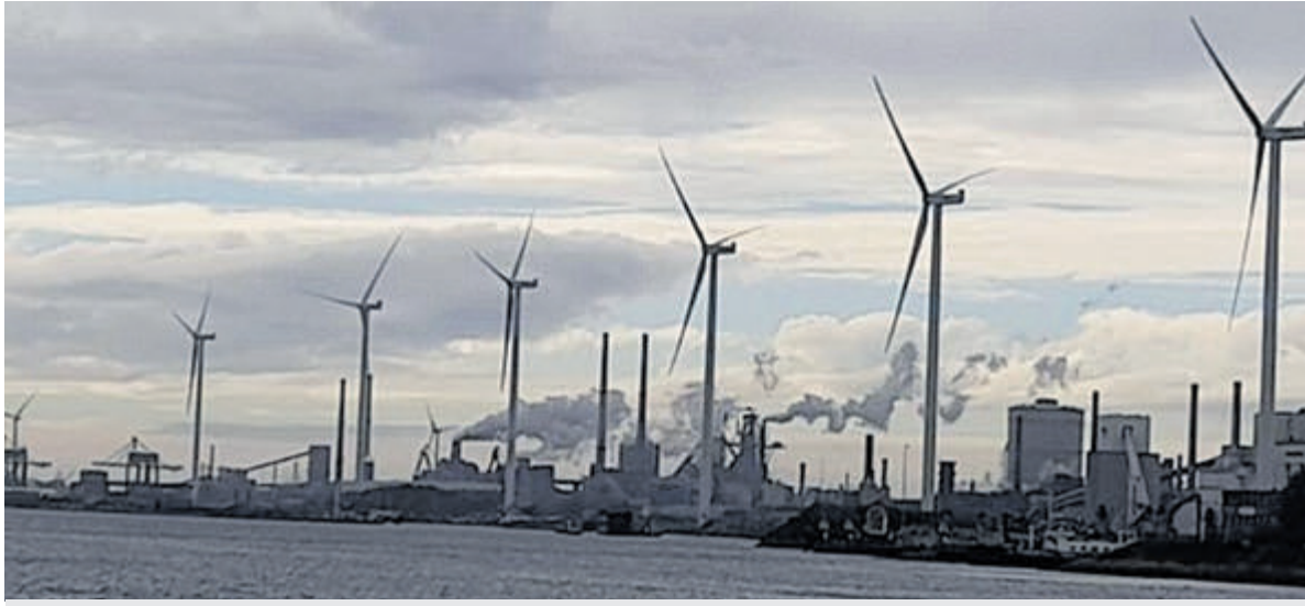
Informatieavond voor geïnteresseerden die overwegen een aanvraag in te dienen bij het Gebiedsfonds Spuisluis.