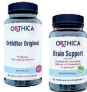
Orthica Compleet assortiment