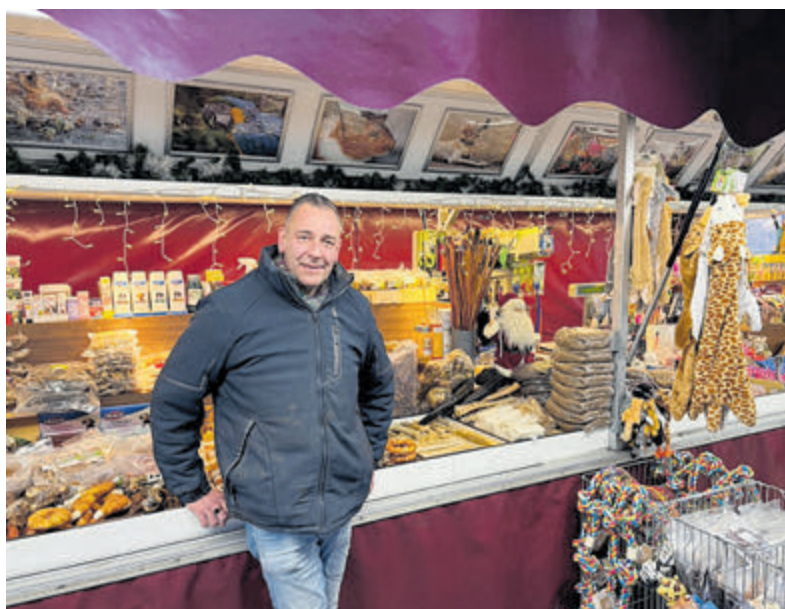
Het gaat op de markt niet alleen om de prijs maar ook om de kwaliteit en aandacht.

Velsen - Op de weekmarkten in Velsbroek, IJmuiden en Santpoort-Noord gaat het tegenwoordig niet alleen om de prijs, maar ook om kwaliteit en persoonlijke aandacht.