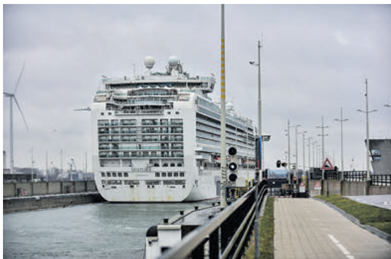
Extinction Rebellion had eerder aangekondigd naar IJmuiden te komen om te demonstreren tegen de komst van cruiseschip Ventura.

IJmuiden - Extinction Rebellion had eerder aangekondigd maandag naar IJmuiden te komen om te demonstreren op de sluisen tegen de komst van cruiseschip Ventura. Ze hebben hun plannen gewijzigd vanwege veiligheidsredenen.