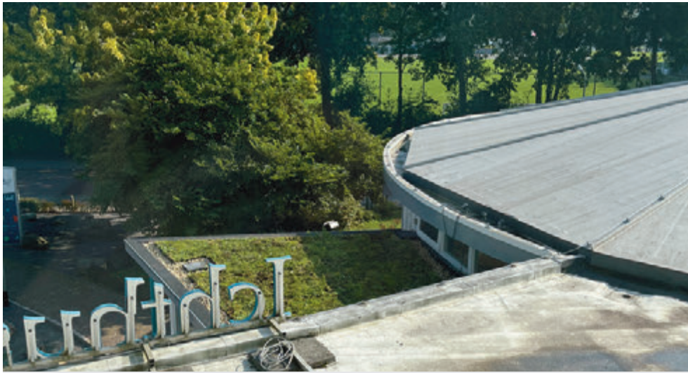
Foto: groen dak Ichthus Lyceum