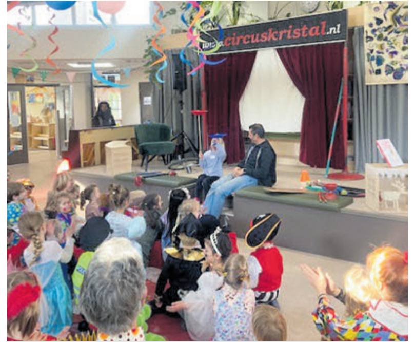
Het vijfjarig bestaan werd groots gevierd samen met Circus Kristal.