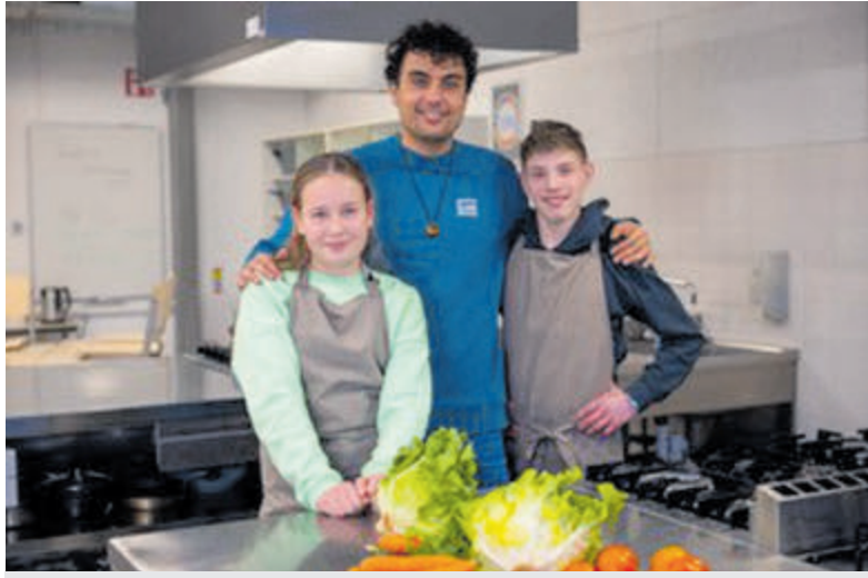
Ben je erbij? Maak kennis en ervaar het zelf.