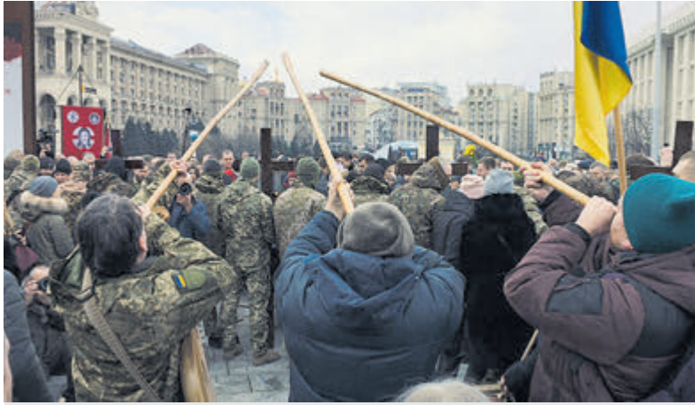
Enmalig te zien: The Invasion.