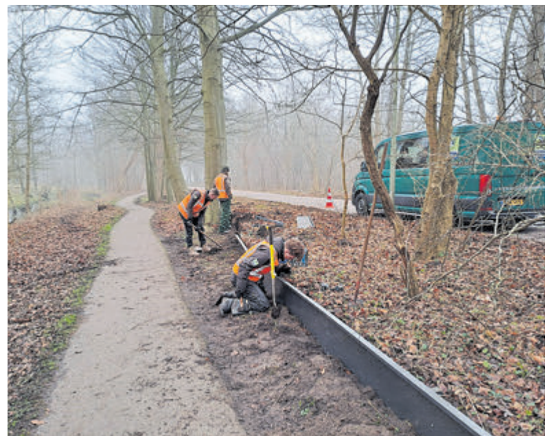
Aanleg paddenscherm in Gemeente Velsen.

dieren maximaal te beschermen. Landschap Noord-Holland beschermt niet alleen natuur in haar eigen natuurgebieden, maar ook in gebieden daarbuiten en in die van opdrachtgevers. Door slimme en duurzame oplossingen draagt de organisatie bij aan de bescherming van niet alleen de padden, maar ook aan het landschap en de biodiversiteit in de directe omgeving.