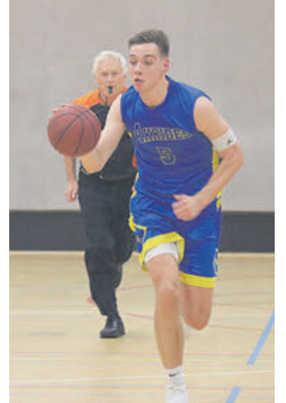
Er zou gerust gaan worden met een stand van 23-32 in het voordeel van Akrides.

kwart ook veelvuldig op de strafworplijn te staan en verzilverde daar acht van de elf door het arbitrale duo toegekende vrije worpen. Akrides won overtuigend met 57-80 en krijgt nu een paar weken rust. Op zaterdagavond 15 maart om 19.15 uur staat voor OOK Akrides in het Indoor Centrum in Landsmeer de eerste volgende wedstrijd uit tegen koploper Landslake Lions op het programma.