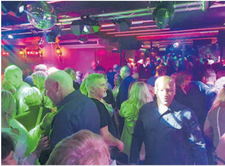
Omdat het zo'n geweldig succes was wordt de reünie weer georganiseerd.

IJmuiden - In de periode 1979 tot 1987 was bar dancing De Lantaarn 'the place to be' als je in IJmuiden wilde uitgaan.