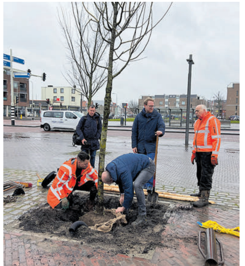
De boom wordt vakkundig opgevangen en in het diepe gat geplaatst met hulp van Nijemanting.

Het vergroenen en klimaatadaptief maken van Plein 1945 is als een van de projecten binnen Pont tot Park meegenomen in het Regioplan Gebiedsinvesteringen op Zee voor het Noordzeekanaalgebied. Met het planten van de bomen is de eerste fase voor het vergroenen gestart. Gemeente Velsen krijgt hiervoor met terugwerkende kracht een ton uit de Gebiedsinvesteringen Netten op Zee. Deze investeringen komen uit het Herstel Veerkracht Plan van de Europese Unie; de realisatie wordt dus mede mogelijk gemaakt door financiering vanuit de Europese Unie.