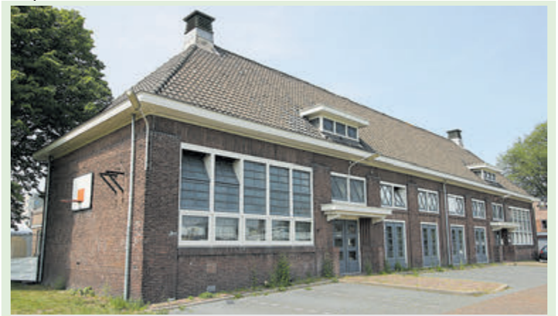
Het in 1924 aangebouwde gymnastieklokaal van School D, tegenwoordig beter bekend als de Muziekschool. Voor IJmuidenaren een monument!

In deze rubriek staan we stil bij een typisch IJmuidens onderwerp aan de hand van een foto en naar aanleiding van de actualiteit, een stukje geschiedenis, een bijzondere gebeurtenis, een evenement of gewoon een van de mooie tafelen die IJmuiden biedt. In deze aflevering aandacht voor de Muziekschool in de voormalige School D (deel 2).