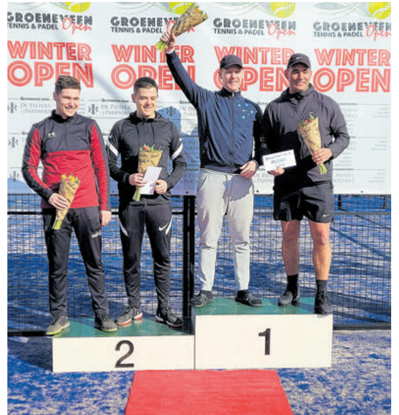
Wie, o wie, neemt zondag de bloemen en prijzen in ontvangst tijdens de huldiging op Medal Plaza?