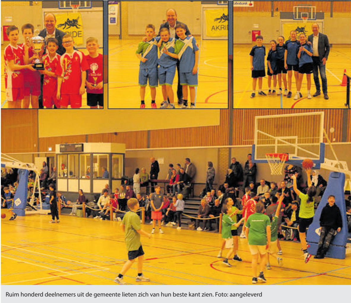
Ruim honderd deelnemers uit de gemeente lieten zich van hun beste kant zien.