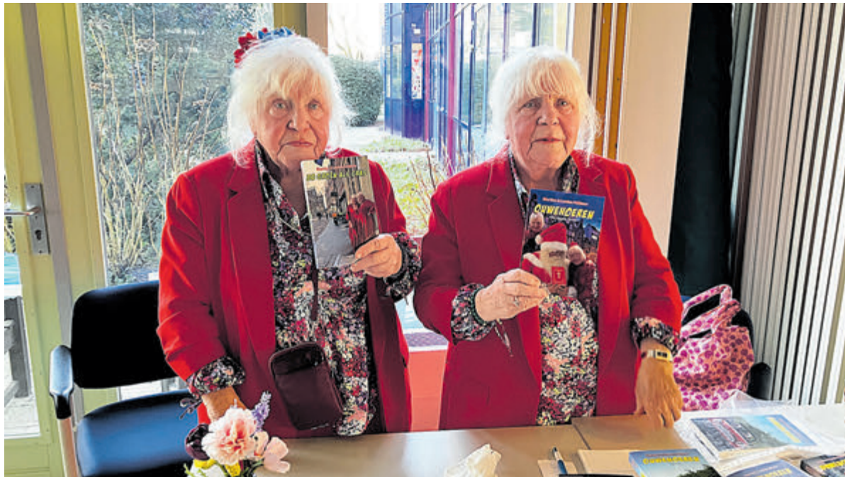
Beide dames lezen een stuk voor uit één van hun boeken.