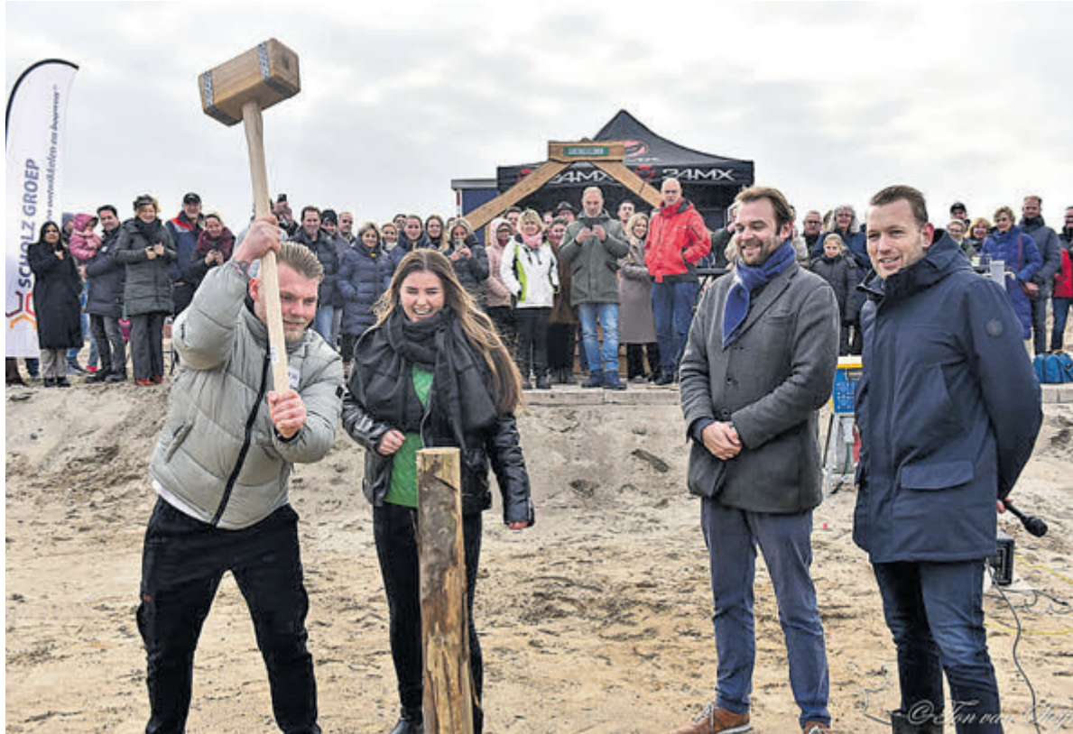
Vincent en Fleur geven een flinke klap op de symbolische eerste paal, die vrijdagmiddag de grond in ging.