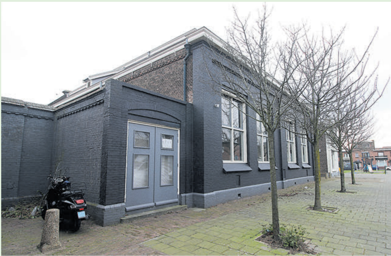
Het oudste deel van School D aan de Heidestraat. Achter de gevel bruist het nog steeds van de activiteiten!

In deze rubriek staan we stil bij een typisch IJmuidens onderwerp aan de hand van een foto en naar aanleiding van de actualiteit, een stukje geschiedenis, een bijzondere gebeurtenis, een evenement of gewoon een van de mooie taferelen die IJmuiden biedt. In deze aflevering aandacht voor de Muziekschool in de voormalige School D (deel 1).