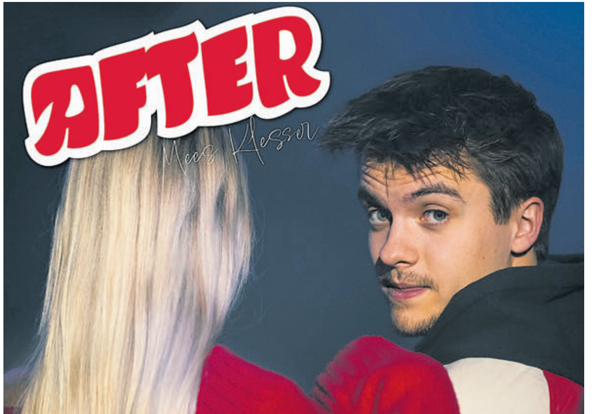
Vrijdag komt de nieuwe single 'After' uit. Afbeelding: aangeleverd

cruciale rol voor mensen die geen geld hebben om nieuwe kleding of schoenen te kopen. Bij de Kledingbank kunnen mensen terecht, met een verwijzing, die dringend kleding nodig hebben, maar dit niet kunnen betalen. Met praktische hulp draagt Kledingbank IJmond bij aan armoedebestrijding in de IJmond en worden er momenteel circa 950 volwassenen en kinderen geholpen. Zie voor nadere informatie de website www.kledingbankijmond.nl .