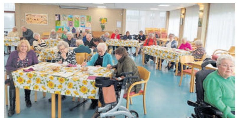
Het was weer een gezellige middag.

Wie meer wil weten: www.facebook.com/p/Platform-Toegankelijkheid-Velsen .