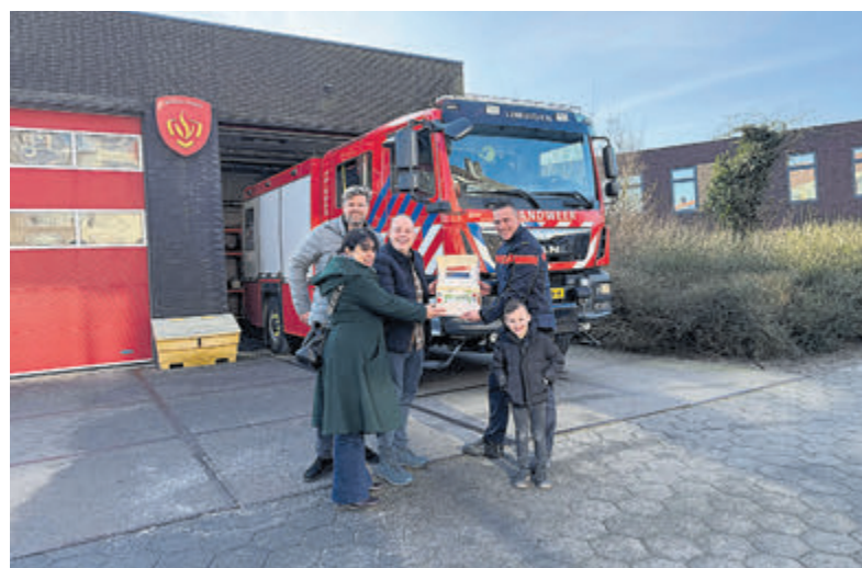
De taart zal ongetwijfeld in de smaak vallen.

IJmuiden - D66Velsen heeft vandaag traditiegetrouw de jaarlijkse Valentijnstaart uitgereikt, dit keer aan de vrijwillige brandweer van Post IJmuiden. Met dit initiatief onderstreept de partij haar grote waardering voor de vrijwilligers die zich dagelijks inzetten om onze gemeenschap veilig te houden.