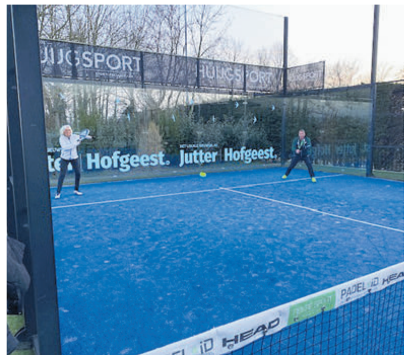
LTC Hofgeest is een gezellige vereniging waar tennis plezier en sportiviteit voorop staat.

banen kan het gehele jaar door gespeeld worden. Leden kunnen elke dag tussen 09.00 uur en 22.45 uur komen tennissen en padellen via het eerlijke, elektronische ahangsysteem. Op de doorde-weekse middagen zijn een aantal banen bestemd voor de jeugdleden. In het gezellige clubhuis is volop gelegenheid voor een hapje en een drankje. De kantine is het gehele jaar geopend en wordt door vrijwilligers bemand. Die vrijwilligers staan bij de club hoog in het vaandel, zij maken onder andere dat de contributie van de club laag kan worden gehouden. En dat dat door iedereen gewaardeerd wordt, werd tijdens de jaarvergadering weer eens heel erg duidelijk.