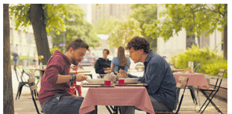
A real pain.