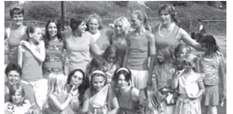
Dat is nog eens een knallend afscheid. Moeders dansen met sterren