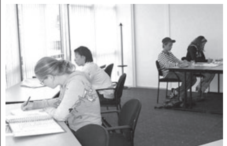
Study Consultancy gaat met examentraining en de combinatie naar sport verder dan alleen huiswerkbegeleiding en bijles

seld. Leden van het Servicepaspoort krijgen korting. Er zijn nog enkele plaatsen voor de cursus die op 14 juli start in IJmuiden. Bent u op dat moment ongeveer 28 weken zwanger, dan kunt u zich nog aanmelden. Nieuw bij het Servicepaspoort is het thema 'gezonde voeding tijdens en na de zwangerschap'. Eind augustus kan deze thema-avond bijgewoond worden in Heemstede. Voor meer informatie en/of aanmelding kunt u bellen naar het Servicepaspoort: telefoon 023-8918 440 of ga naar www.servicepaspoort.nl