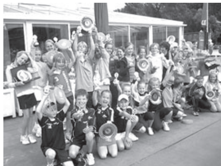
De finalisten op woensdag

De Rabobank is dé stabiele factor in de spaarmarkt. Zij hebben als enige bank in Nederland een triple A-status en daardoor bieden zij veruit de meeste zekerheid. Vroeger, nu en in de toekomst! Rabobank Velsen en Omstreken, het is tijd voor u.