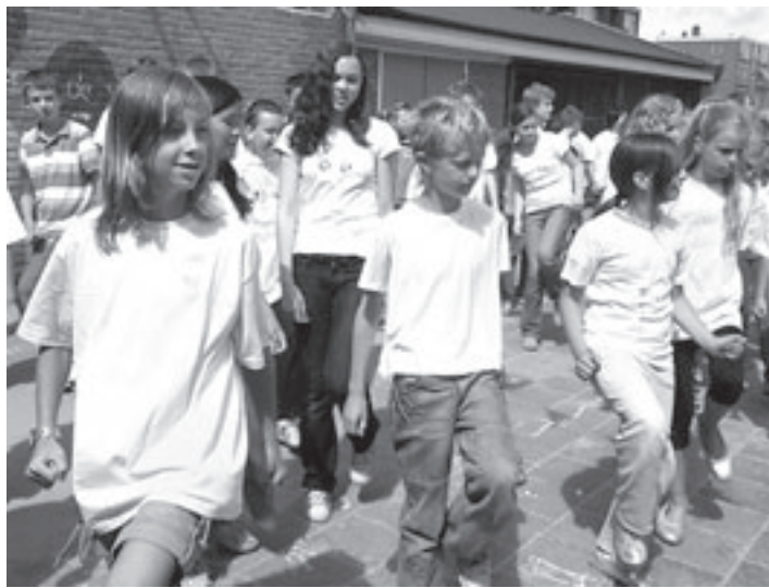
De groepen zeven en acht tijdens hun danspresentatie

te leven met deze handicap. Niemand vindt het prettig een ander een hand te geven die nat is. Dat is voor de ontvanger net zoiets als een natte zoen van een wildvreemde.” De meeste antizweetoperaties worden uitgevoerd voor handen en oksels. Volgens Dur zijn het vooral stewardessen, leraren en mensen die voor hun beroep veel handen schudden die voor de ingreep kiezen. Het Rode Kruis Ziekenhuis doet tien tot vijftien operaties per jaar. Die bestaat uit een kijkoperatie in de borstholte, waarbij enkele centimeters van het autonome zenuwstelsel aan beide kanten wordt weggenomen. „Dit geeft in ieder geval een blijvend resultaat”, aldus de arts.