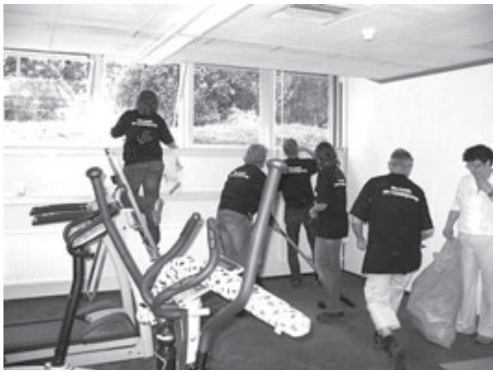
Medewerkers van Corus hebben geen hart van staal, maar van goud. Zij klussen deze weken voor het goede doel met de Hartenactie

Pogingen van FNV Bondgenoten om met Bovag te onderhandelen over een CAO voor tankstations liepen in april op niks uit. Bovag weigerde te praten over meer dan 2 procent loonsverhoging. Vrijdag 27 juni heeft Berghuis opnieuw overleg met BOVAG over een CAO voor tankstations. Tegelijkertijd wordt door werknemers van tankstations die dag actie gevoerd.