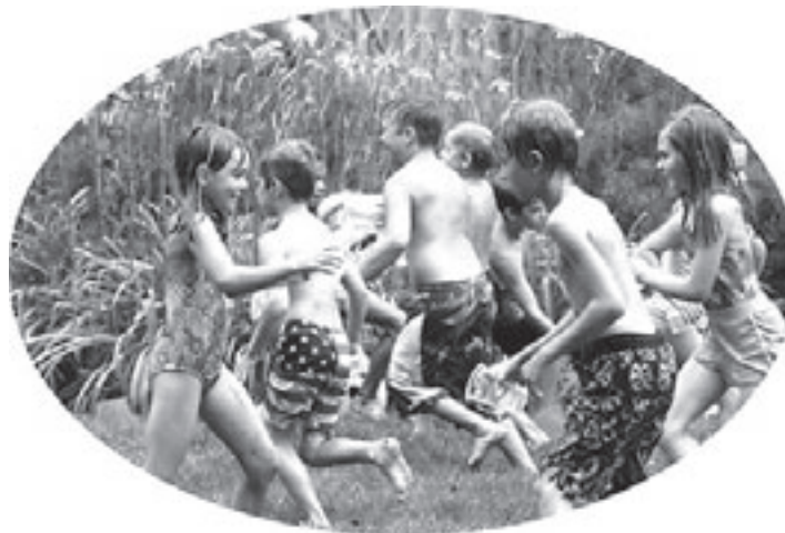
Olympische waterspelen bij Informatieboerderij Zorgvrij