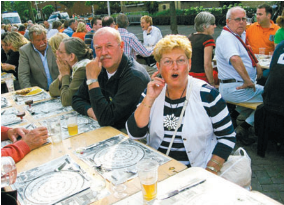
Driehonderd gasten genieten van een viergangen diner

'Nooit meer een dorpsfeest tijdens een EK-wedstrijd'