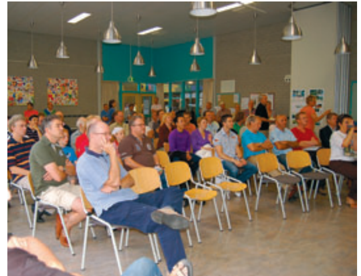
Veel belangstelling voor de bijeenkomst van Actiegroep Velsbroek Oost