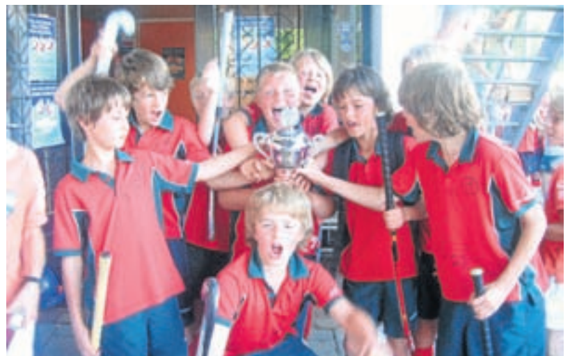
Strawberries 8D1 is kampioen geworden bij het Hemels D toernooi van HC Bloemendaal.