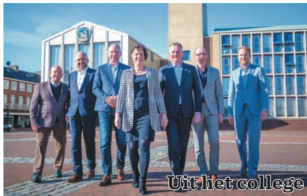
Uit het college

Kosten 2,50 inclusief (warm) drankje en toegangskaart Pieter Vermeulen Museum. Meer informatie en kaarten via brakijmuiden.nl .