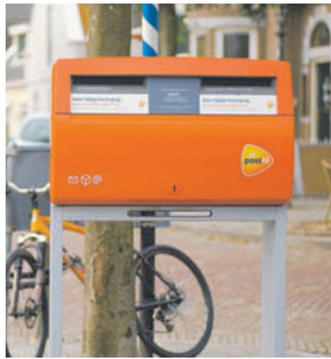
pakketautomaten en PostNL-punten bij woon in de buurt.

We versturen met z'n allen steeds minder post. PostNL leegt daardoor elke dag brievenbussen waar nauwelijks of geen post in zit. Daarom gaat PostNL vier brievenbussen verwijderen in Velsen. Vanaf 9 september verwijdert PostNL de brievenbussen in de volgende straten: Nicolaas Beetslaan in Driehuis, Zon Bastion in Velsersbroek, Hoofdstraat en J.T. Cremerlaan in Santpoort-Noord. In heel Noord-Holland haalt PostNL 192 van 1.192 brievenbussen weg. In Velsen staat nog steeds binnen een straal van 1 kilometer een brievenbus. Daarnaast komen er steeds meer automaten, waarin je pakketten én brieven kunt versturen. Op postnl.nl/locatiewijzer vind je alle brievenbussen, brief- en