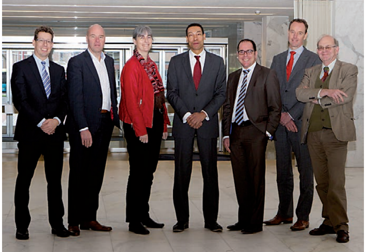
De burgemeester en de wethouders van Velsen wensen u allen fijne feestdagen en een gelukkig nieuwjaar.

De burgemeester en de wethouders verrichten ook heel veel onzichtbaar werk. De verzamelnaam daarvan is: lobbyen. Dat doen zij met verve, anytime, anyplace en op elk niveau.